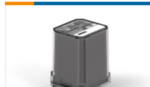
TE 系列/零件编号2- 1415546-8 RM622024