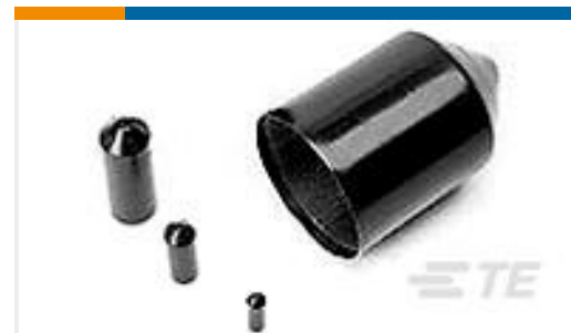
TE 系列/零件编号811353- 000 101A031-12-0