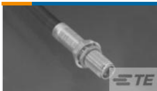
TE 系列/零件编号5448103-2 BULKHEAD JACK, SMA, HEX CRIMP