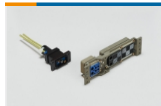
机架和配线架连接器(1)