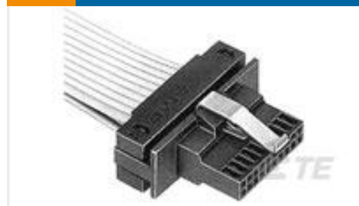
TE 系列/零件编号6-104892-0 100 50/50 GRID RCPT W /LTCH LF