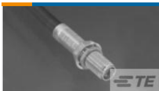
TE 系列/零件编号5448103-2 BULKHEAD JACK, SMA, HEX CRIMP