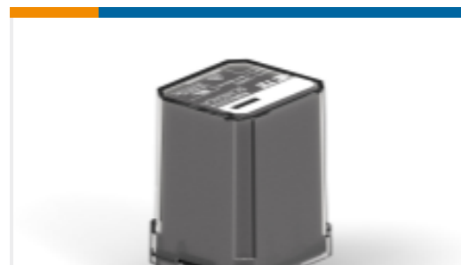
TE 系列/零件编号2- 1415546-8 RM622024