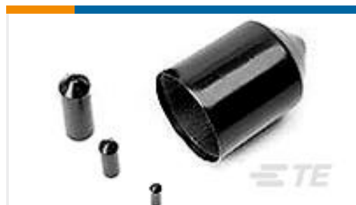
TE 系列/零件编号811353- 000 101A031-12-0