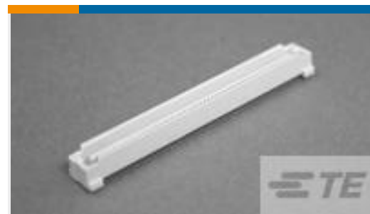
TE 系列/零件编号5177984-9 0.8FH,P05H.5,180,08/Sn,TU