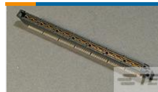
TE 系列/零件编号5767057-7 MICT,495,PLUG,266,PDNI