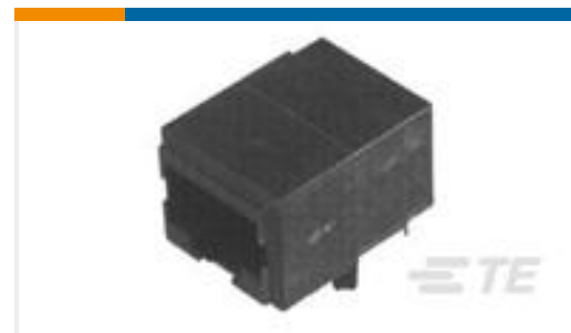
TE 系列/零件编号5557804-1 MJ ASSY,8POS,R/A,KEYED