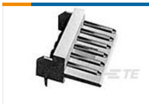
TE 系列/零件编号4-171826-2 H-TYPE E.I.S.CONN. 2P ASSY