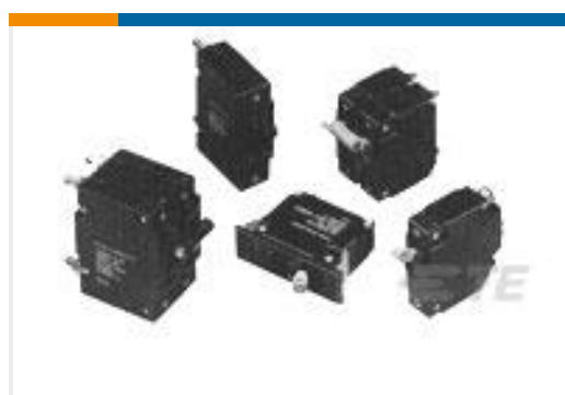
TE 系列/零件编号3-1393253-0 W68-X2Q12-10V=M6/M7 /M9/W6/W7