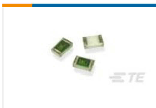
TE 系列/零件编号6-1879128-5 RN 0402 909R 0.1% 10PPM 1K RL