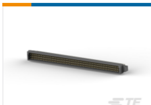
TE 系列/零件编号5650950-5 150 EURO TYPE C PIN ST ASSY