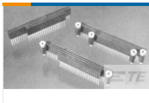
TE 系列/零件编号1375794-1 ASSY, 64/40 POS PC104