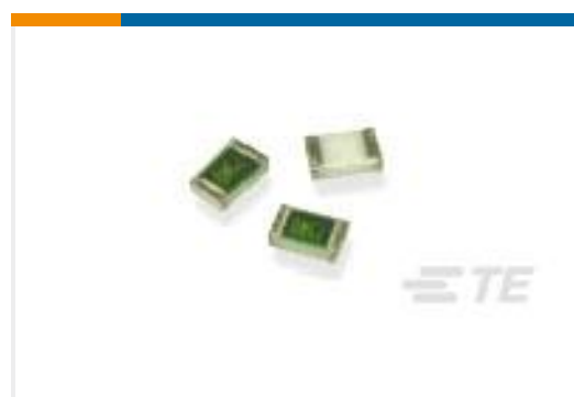
TE 系列/零件编号1-1879129-4 RN 0402 1K33 0.1% 10PPM 1K RL