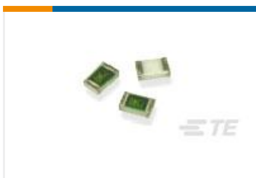
TE 系列/零件编号5-1879131-6 RN 0402 9K09 0.1% 10PPM 1K RL