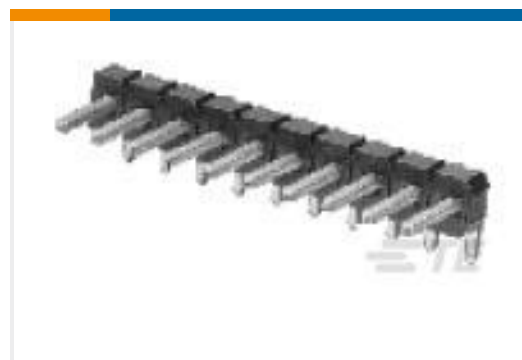
TE 系列/零件编号103323-6 06 MODII HDR SRRA B/A . 100CL