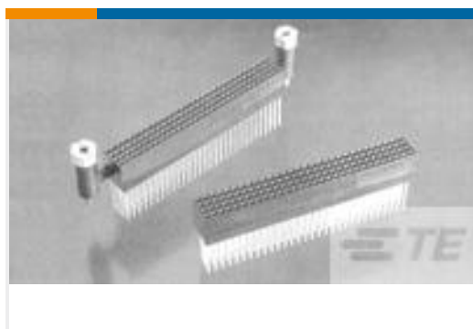
TE 系列/零件编号1375798-1 ASSY, 120 POS PC104 PLUS