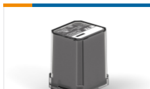
TE 系列/零件编号2- 1415546-8 RM622024