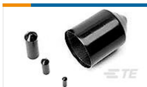
TE 系列/零件编号811353- 000 101A031-12-0