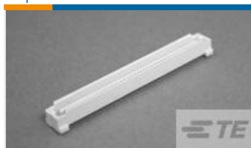
TE 系列/零件编号5177984-9 0.8FH,P05H.5,180,08/Sn,TU