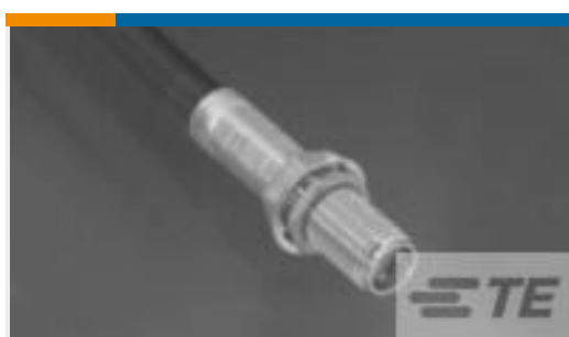
TE 系列/零件编号5448103-2 BULKHEAD JACK, SMA, HEX CRIMP