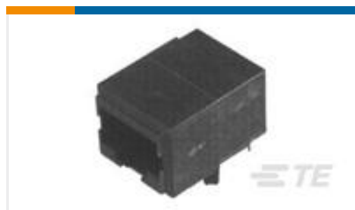
TE 系列/零件编号5557804-1 MJ ASSY,8POS,R/A,KEYED