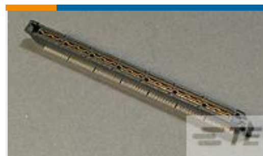
TE 系列/零件编号5767057-7 MICT,495,PLUG,266,PDNI