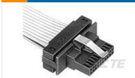
TE 系列/零件编号6-104892-0 100 50/50 GRID RCPT W /LTCH LF