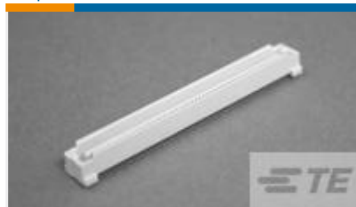
TE 系列/零件编号5177984-9 0.8FH,P05H.5,180,08/Sn,TU