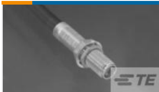
TE 系列/零件编号5448103-2 BULKHEAD JACK, SMA, HEX CRIMP