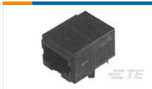
TE 系列/零件编号5557804-1 MJ ASSY,8POS,R/A,KEYED