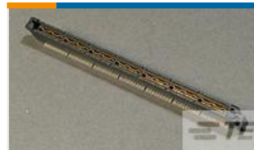
TE 系列/零件编号5767057-7 MICT,495,PLUG,266,PDNI