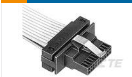
TE 系列/零件编号6-104892- 0 100 50/50 GRID RCPT W /LTCH LF