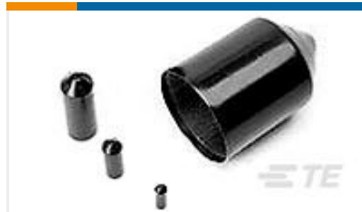
TE 系列/零件编号811353- 000 101A031-12-0