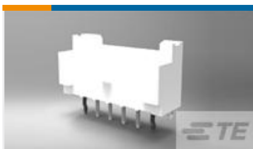
TE 系列/零件编号1-1744418-2 12 POS EP 2.5 HDR, GLOW WIRE