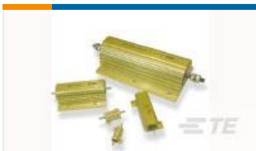
TE 系列/零件编号3-1630019-8 HSC200 R14 5%