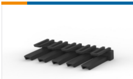
TE 系列/零件编号1744544-5 EP II TPA 05P, BLACK