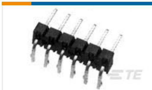
TE 系列/零件编号5-104349-6 08 MODII HDR SRRA B/A W/HLDWN LF