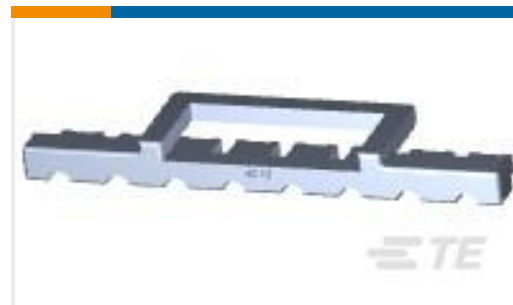
TE 系列/零件编号8-1971794-1 NEW GI CONN2.5 TPA 8P BLACK