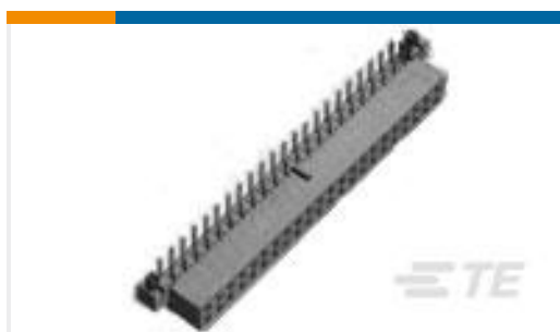
TE 系列/零件编号2-1470108-6 2.0MM PITCH HEADER, DIP 26P