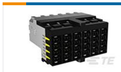
TE 系列/零件编号2198267-2 SW 360, 4x6, 4.5, Sn