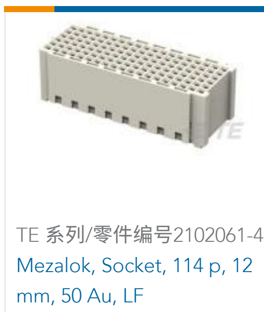
TE 系列/零件编号2102061-4 Mezalok, Socket, 114 p, 12 mm, 50 Au, LF