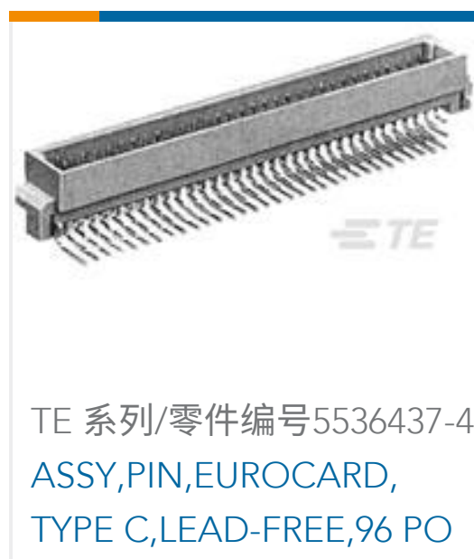
TE 系列/零件编号5536437-4 ASSY, PIN, EUROCARD, TYPE C, LEAD-FREE, 96 PO