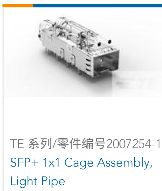
TE 系列/零件编号2007254-1 SFP+ 1x1 Cage Assembly, Light Pipe