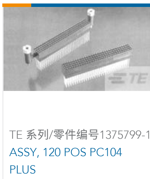
TE 系列/零件编号1375799-1 ASSY, 120 POS PC104 PLUS