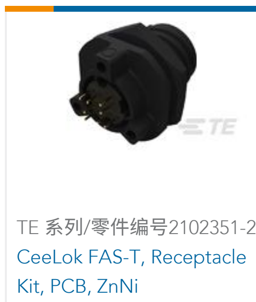
TE 系列/零件编号2102351-2 CeeLok FAS-T, Receptacle Kit, PCB, ZnNi