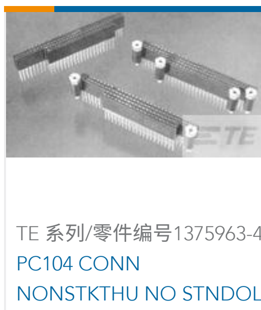
TE 系列/零件编号1375963-4 PC104 CONN NONSTKTHU NO STNDOL