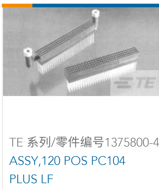
TE 系列/零件编号1375800-4 ASSY, 120 POS PC104 PLUS LF