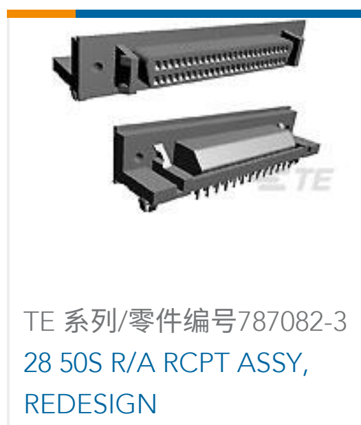
TE 系列/零件编号787082-3 28 50S R/A RCPT ASSY, REDESIGN