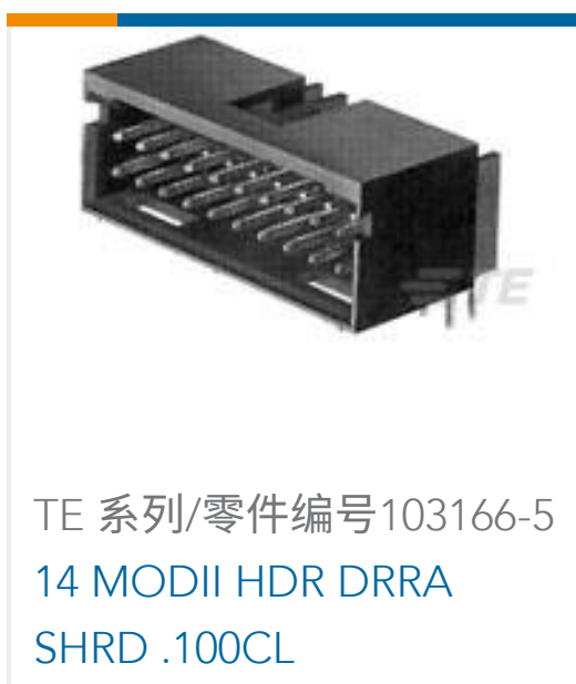
TE 系列/零件编号103166-5 14 MODII HDR DRRA SHRD .100CL