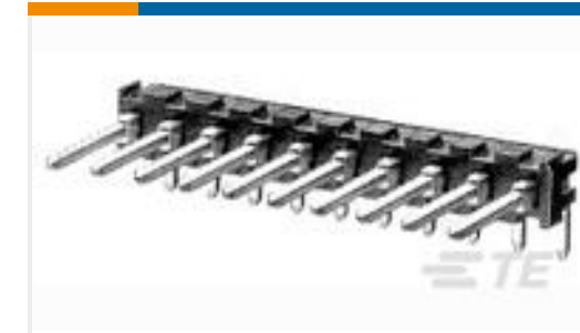
TE 系列/零件编号1-87232-1 11 MODII HDR SRRA UNSHRD .100