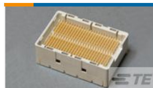
TE 系列/零件编号6-1761612-3 STEP-Z PLUG 13MM 104P LF ST