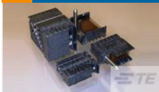
TE 系列/零件编号2143019-2 IMP100S,H,RA2P10C,RG, LEW39,4.9