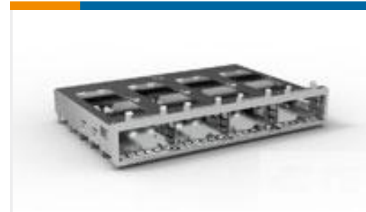
TE 系列/零件编号2007668-1 1x4 QSFP Cage Assy Behind Bzl, LP Holder