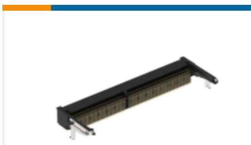
TE 系列/零件编号2309413-3 DDR4 SODIMM 260P 9.2H STD