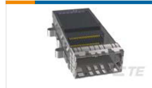
TE 系列/零件编号2149701-1 Receptacle Assembly