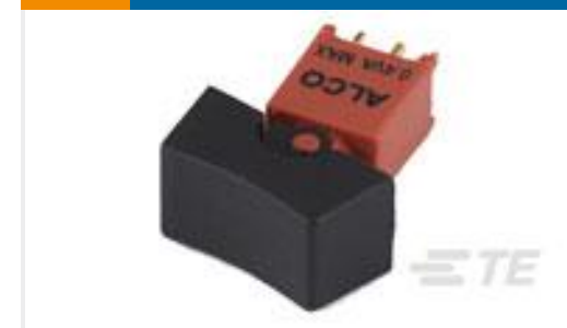
TE 系列/零件编号2267088-4 RAD1R102M6QES