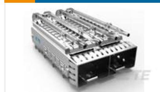
TE 系列/零件编号2198232-3 SFP+ Enhanced 1x2, Network Heatsink, LP