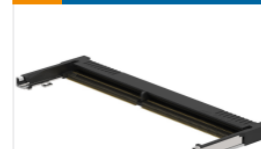
TE 系列/零件编号2309407-3 DDR4 SODIMM 260P 4.0H STD