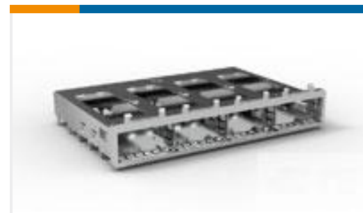
TE 系列/零件编号2007668-1 1x4 QSFP Cage Assy Behind Bzl, LP Holder