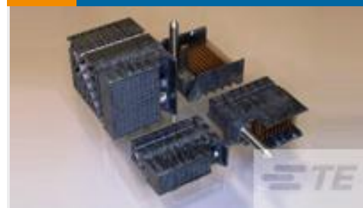
TE 系列/零件编号2143019-2 IMP100S,H,RA2P10C,RG, LEW39,4.9