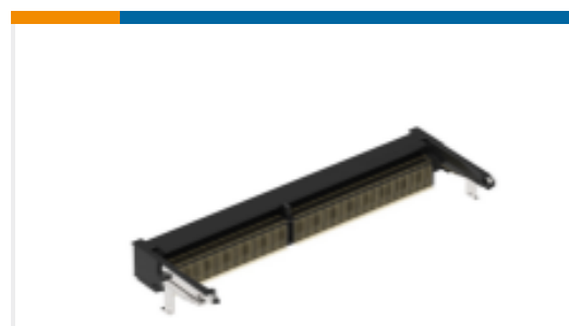
TE 系列/零件编号2309413-3 DDR4 SODIMM 260P 9.2H STD