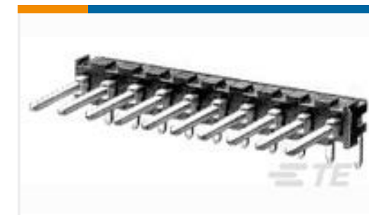
TE 系列/零件编号1-87232-1 11 MODII HDR SRRA UNSHRD .100