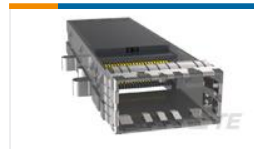
TE 系列/零件编号2149733-1 Receptacle Assembly