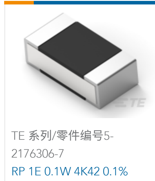
TE 系列/零件编号5- 2176306-7 RP 1E 0.1W 4K42 0.1% 25PPM 5K RL