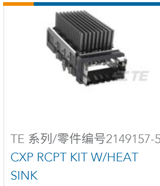
TE 系列/零件编号2149157-5 CXP RCPT KIT W/HEAT SINK