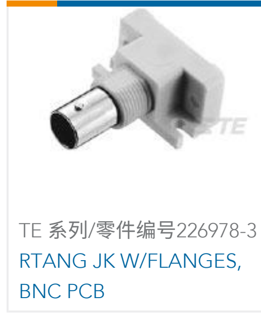
TE 系列/零件编号226978-3 RTANG JK W/FLANGES, BNC PCB