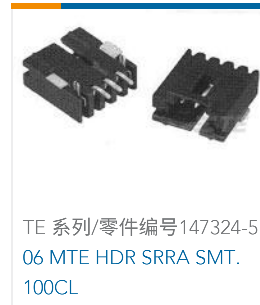
TE 系列/零件编号147324-5 06 MTE HDR SRRA SMT. 100CL