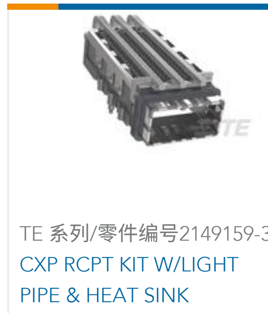
TE 系列/零件编号2149159-3 CXP RCPT KIT W/LIGHT PIPE & HEAT SINK