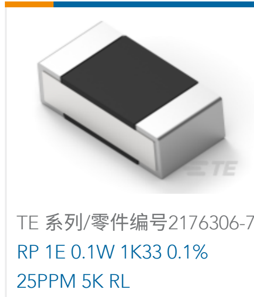
TE 系列/零件编号2176306-7 RP 1E 0.1W 1K33 0.1% 25PPM 5K RL