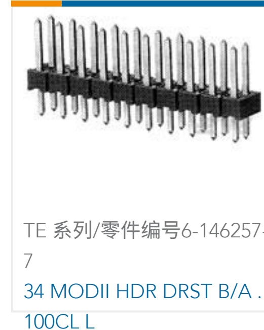
TE 系列/零件编号6-146257- 7 34 MODII HDR DRST B/A. 100CL L