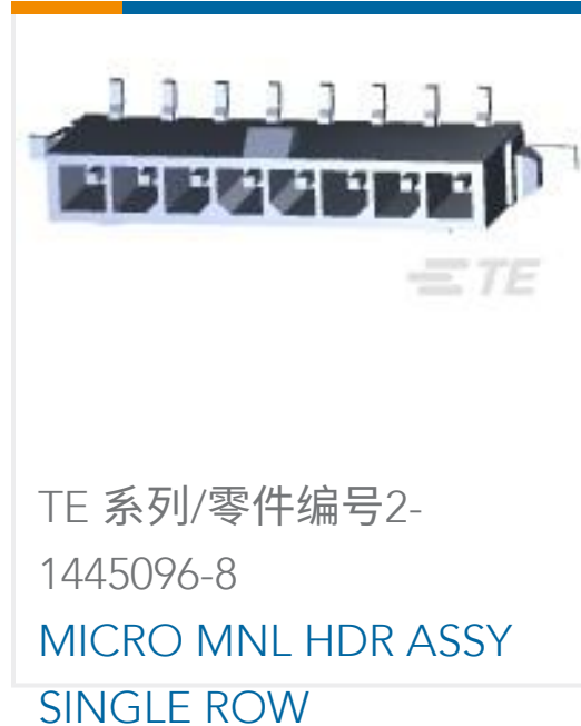
TE 系列/零件编号2- 1445096-8 MICRO MNL HDR ASSY SINGLE ROW