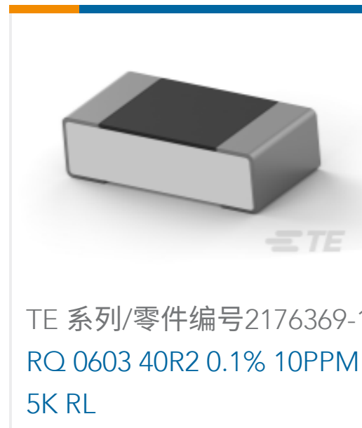
TE 系列/零件编号2176369-1 RO 0603 40R2 0.1% 10PPM 5K RL