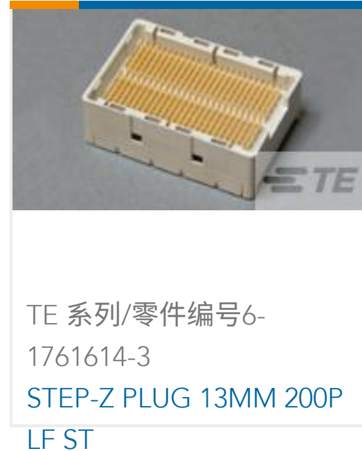
TE 系列/零件编号6- 1761614-3 STEP-Z PLUG 13MM 200P LF ST