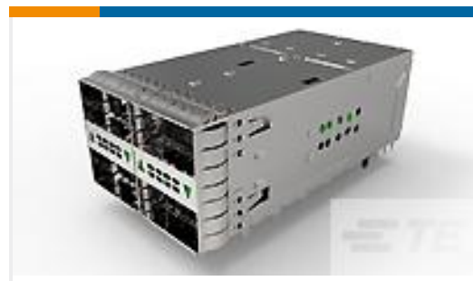
TE 系列/零件编号2227670-2 zQSFP+ STACKED RECEPTACLE ASSEMBLY 2X2