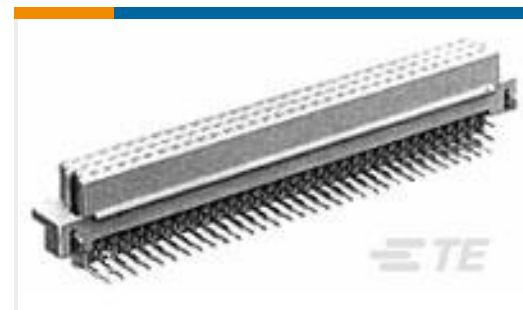
TE 系列/零件编号650870-5 064 EURO TYPE R RECEPT ASSY