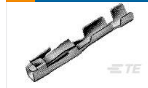
TE 系列/零件编号5531216-3 CONT.TDM.SPRING STRIP