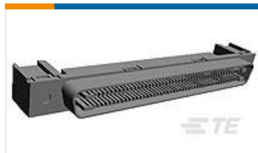
TE 系列/零件编号5787885-1 200 CMP DCK RA PLG INV SHL 3.4