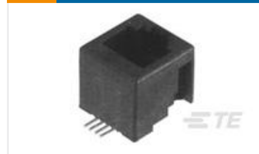
TE 系列/零件编号4-338088- 3 8/8 INV.MOD.JACK