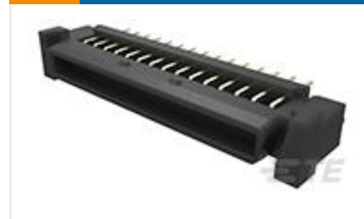
TE 系列/零件编号5176374-1 AMP FH CONN REC V 40P (H=14)