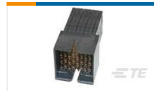
TE 系列/零件编号1934349-1 TinMan R/A Header Assy 5x8 Open