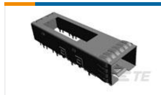
TE 系列/零件编号2057021-1 SFP+ 1x1 Cage Assy, Short Solder Tail