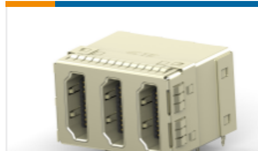
TE 系列/零件编号2295556-1 Std HDMI, Flag, T/H, 3 in 1 (Row)