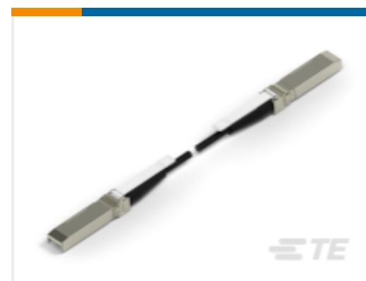
TE 系列/零件编号 2127931-2 C/A, SFP+, GENERIC, 1.0M