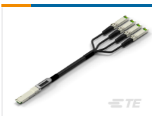
TE 系列/零件编号 2334236-2 QSFP TO [4]SFP+, 28G, 30AWG, 1 METER