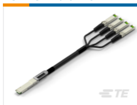
TE 系列/零件编号 2334236-6 QSFP TO [4]SFP25GIG, 30AWG 3 METER