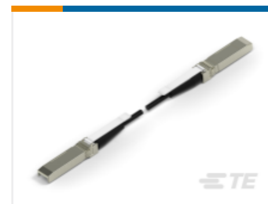
TE 系列/零件编号 2127931-4 C/A, SFP+, GENERIC, 3.0M