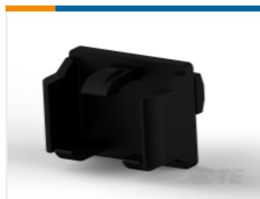
TE 系列/零件编号 1761394-1 DUST COVER, SFP, GANGED & STACKED