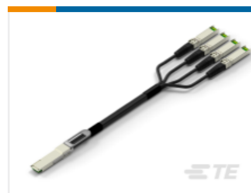
TE 系列/零件编号 2334878-6 QSFP TO [4]SFP 25GIG, 26AWG 3 METER