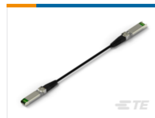
TE 系列/零件编号 2821222-1 SFP28 DIRECT ATTACH CA, 3M, 30AWG