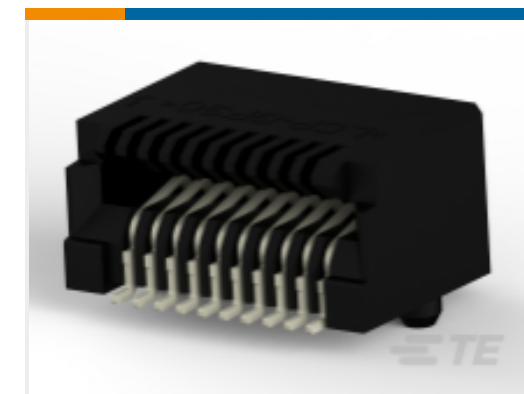
TE 系列/零件编号 1888247-2 20 POS SMT CONN, SFP /SFP+, 15A