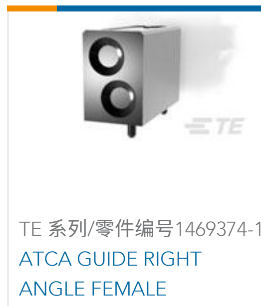
TE 系列/零件编号1469374-1 ATCA GUIDE RIGHT ANGLE FEMALE