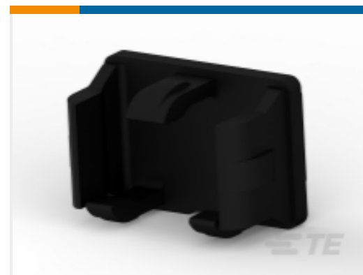
TE 系列/零件编号 1367147-1 SFP COVER, UNPLATED