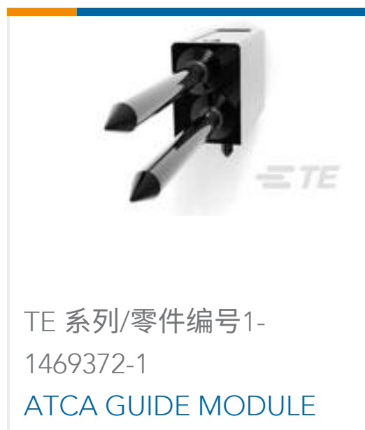
TE 系列/零件编号1- 1469372-1 ATCA GUIDE MODULE RA MALE