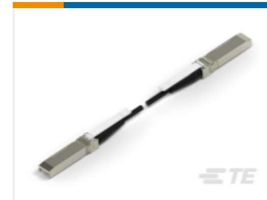
TE 系列/零件编号 2127931-4 C/A, SFP+, GENERIC, 3.0M