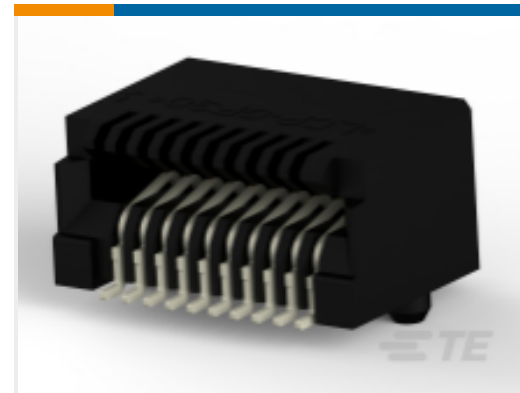
TE 系列/零件编号 1888247-1 20 POS SMT CONN, SFP /SFP+, 30A