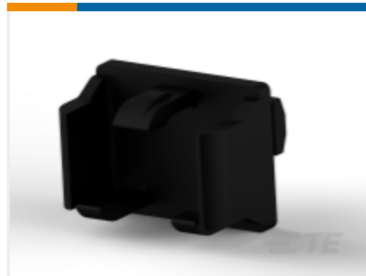
TE 系列/零件编号 1761394-1 DUST COVER, SFP, GANGED & STACKED