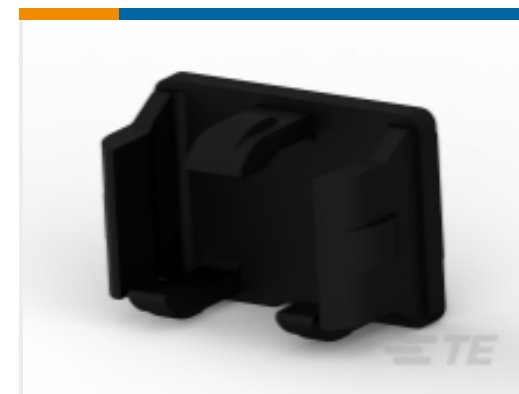
TE 系列/零件编号 1367147-3 SFP COVER, UNPL, NO LOGO