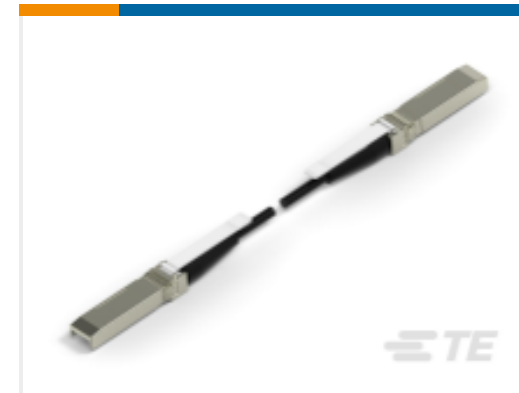
TE 系列/零件编号 2127931-2 C/A, SFP+, GENERIC, 1.0M