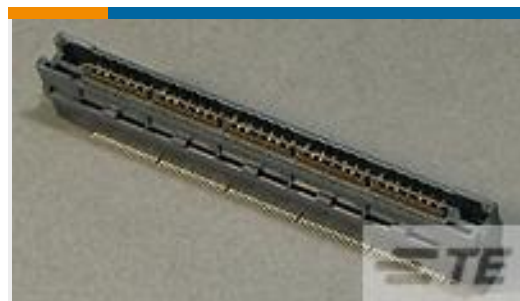
TE 系列/零件编号5767095-5 MICT,REC,EXT,190,ASY, PDNI,025