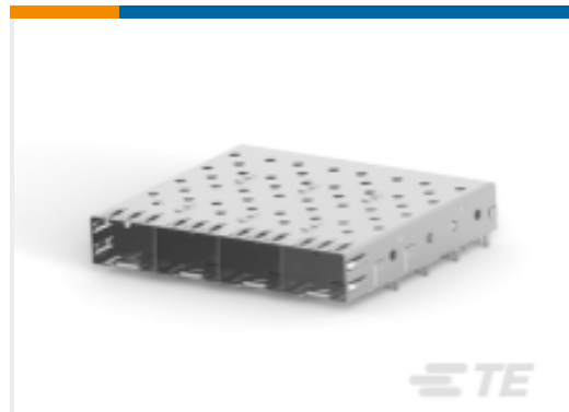
TE 系列/零件编号1658744-3 SFP 1X4 CAGE ASSY