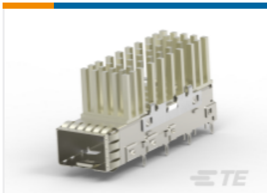
TE 系列/零件编号2291634-3 SFP+ 1X1 CAGE ASSY, PF, WITH HEATSINK