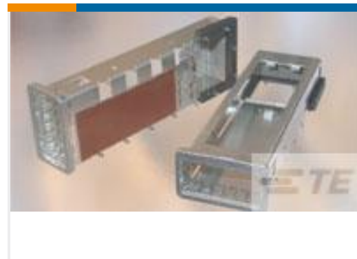
TE 系列/零件编号1658945-1 XFP CAGE ASSY w/o ELASTOMERIC GASKET