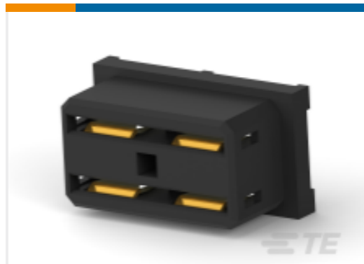
TE 系列/零件编号2169809-1 IMP,Power,4PR,VR,Tin