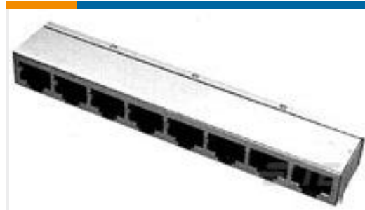
TE 系列/零件编号2007073-2 INV MJ ASSY,1X8,PNL GRD,w/LED