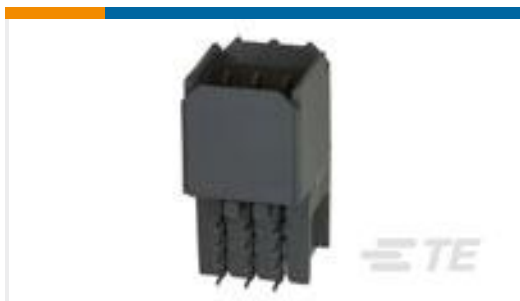
TE 系列/零件编号5223961-8 UNV,PWR,MDL.HDR,R- PEGS