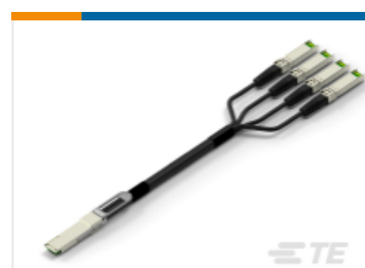
TE 系列/零件编号 2334878-6 QSFP TO [4]SFP 25GIG 26AWG 3 METER