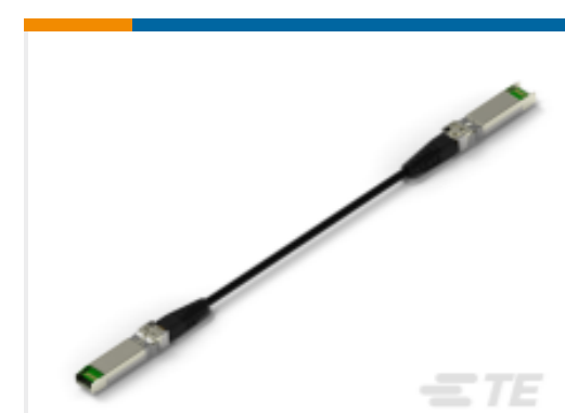
TE 系列/零件编号 2821222-1 SFP28 DIRECT ATTACH CA, 3M, 30AWG