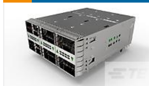
TE 系列/零件编号2227671-2 zQSFP+ STACKED RECEPTACLE ASSEMBLY 2X3