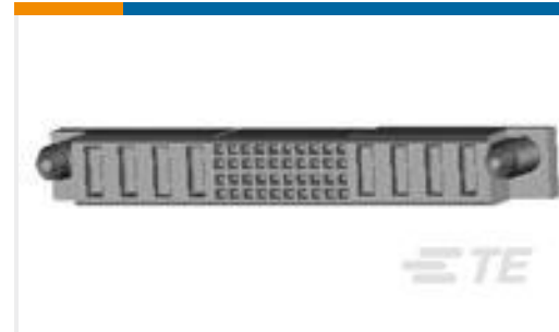
TE 系列/零件编号2- 6450550-9 MBXL VERT RCPT 4P+40S+4P