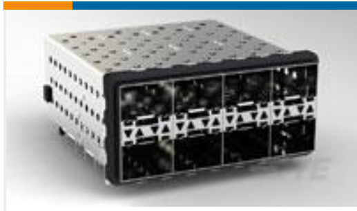
TE 系列/零件编号2007399-5 SFP+assy 2x4 Gasket 4 Lp Sn