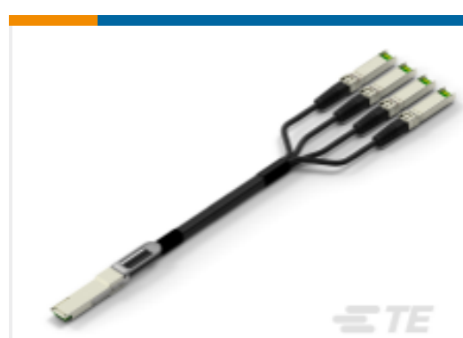
TE 系列/零件编号 2334236-2 QSFP TO [4]SFP+, 28G, 30AWG, 1 METER