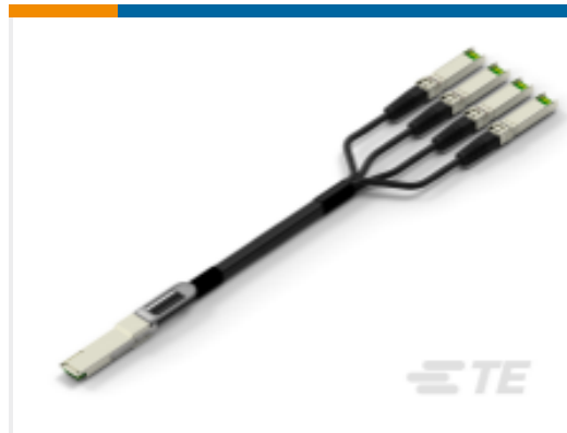
TE 系列/零件编号 2334236-6 QSFP TO [4]SFP25GIG, 30AWG, 3 METER