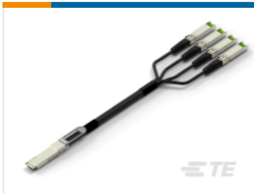
TE 系列/零件编号 2334236-2 QSFP TO [4]SFP+, 28G, 30AWG, 1 METER