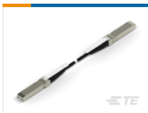
TE 系列/零件编号 2127931-2 C/A, SFP+, GENERIC, 1.0M