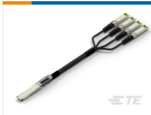
TE 系列/零件编号 2334878-6 QSFP TO [4]SFP 25GIG, 26AWG, 3 METER