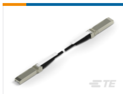
TE 系列/零件编号 2127931-4 C/A, SFP+, GENERIC, 3.0M