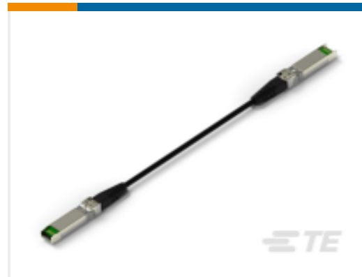
TE 系列/零件编号 2821222-1 SFP28 DIRECT ATTACH CA, 3M, 30AWG