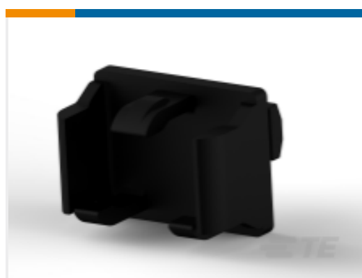
TE 系列/零件编号 1761394-1 DUST COVER, SFP, GANGED & STACKED