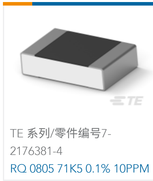
TE 系列/零件编号7- 2176381-4 RQ 0805 71K5 0.1% 10PPM 5K RL