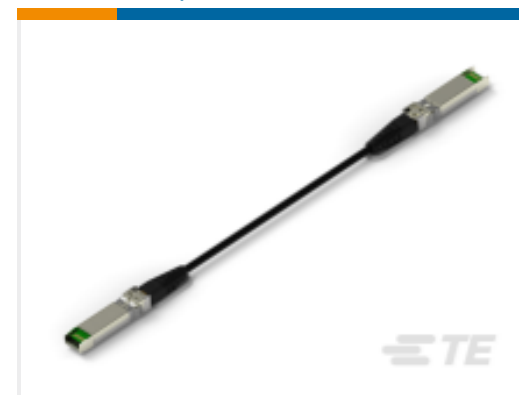
TE 系列/零件编号 2821222-2 SFP28 DIRECT ATTACH CA, 2M, 30AWG