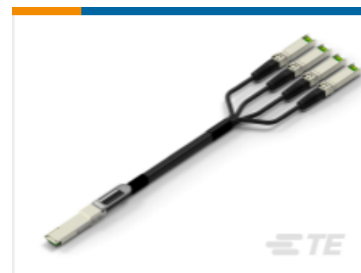
TE 系列/零件编号 2334236-2 QSFP TO [4]SFP+, 28G, 30AWG, 1 METER