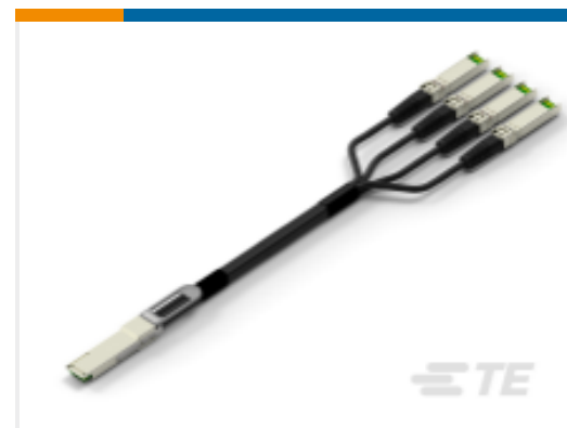
TE 系列/零件编号 2334878-6 QSFP TO [4]SFP 25GIG 26AWG 3 METER