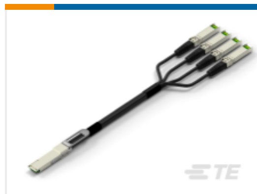
TE 系列/零件编号 2334236-6 QSFP TO [4]SFP25GIG 30AWG 3 METER