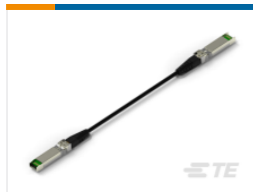
TE 系列/零件编号 2821222-1 SFP28 DIRECT ATTACH CA, 3M, 30AWG