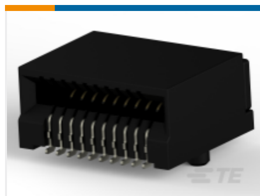
TE 系列/零件编号 2110759-1 PT CONN ASSY 20 POS 16G SFP