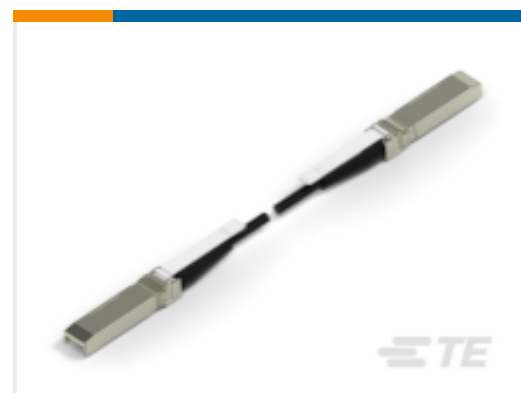
TE 系列/零件编号 2127931-4 C/A, SFP+, GENERIC, 3.0M