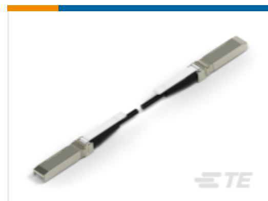
TE 系列/零件编号 2127931-2 C/A, SFP+, GENERIC, 1.0M