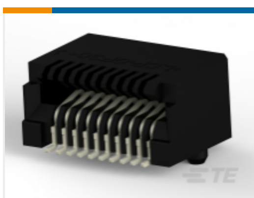
TE 系列/零件编号 1888247-2 20 POS SMT CONN, SFP /SFP+, 15A