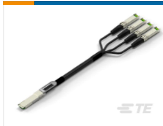
TE 系列/零件编号 2334236-6 QSFP TO [4]SFP25GIG 30AWG 3 METER