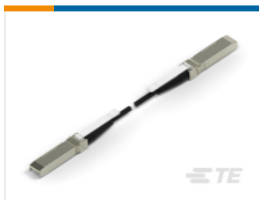
TE 系列/零件编号 2127931-2 C/A, SFP+, GENERIC, 1.0M