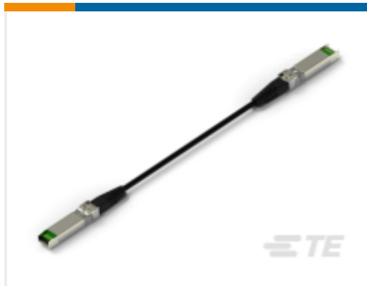
TE 系列/零件编号 2821222-1 SFP28 DIRECT ATTACH CA, 3M, 30AWG