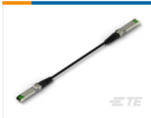
TE 系列/零件编号 2821222-2 SFP28 DIRECT ATTACH CA, 2M, 30AWG