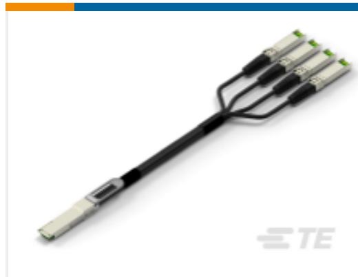
TE 系列/零件编号 2334878-6 QSFP TO [4]SFP 25GIG 26AWG 3 METER