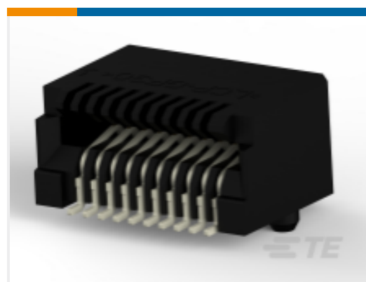
TE 系列/零件编号 1888247-1 20 POS SMT CONN, SFP /SFP+, 30A