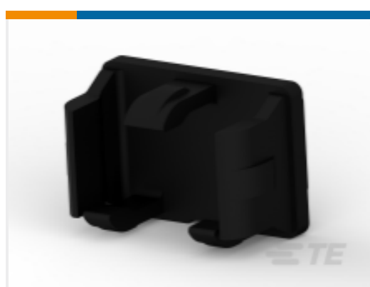
TE 系列/零件编号 1367147-1 SFP COVER, UNPLATED