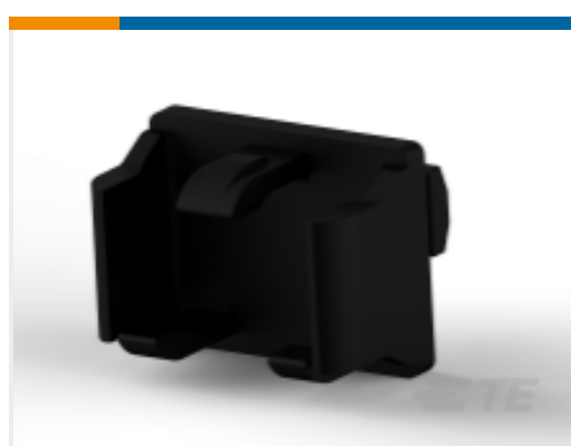
TE 系列/零件编号 1761394-1 DUST COVER, SFP, GANGED & STACKED