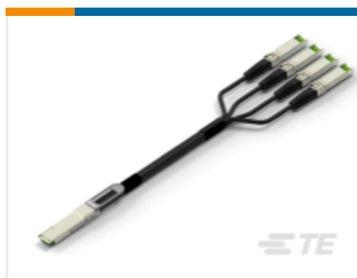
TE 系列/零件编号 2334236-2 QSFP TO [4]SFP+, 28G, 30AWG, 1 METER