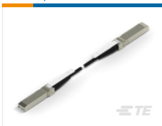
TE 系列/零件编号 2127931-4 C/A, SFP+, GENERIC, 3.0M