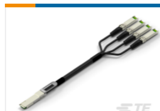
TE 系列/零件编号 2334878-6 QSFP TO [4]SFP 25GIG 26AWG 3 METER