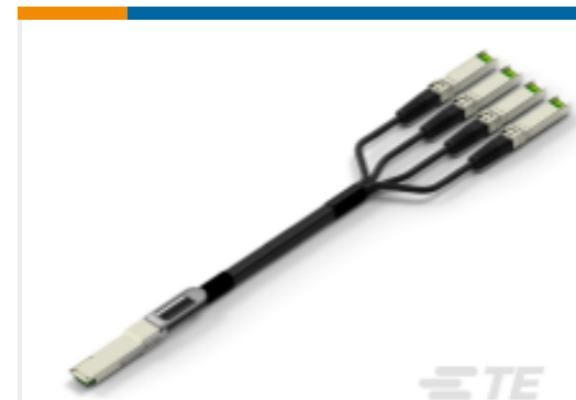
TE 系列/零件编号 4-2334878-6 QSFP TO [4]SFP 56GIG 26AWG 3 METER