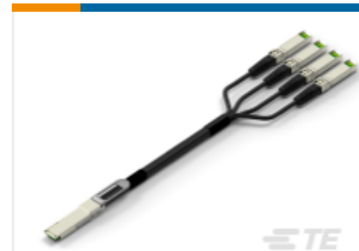
TE 系列/零件编号 4-2334236-2 QSFP TO [4]SFP 56GIG 30AWG 1 METER