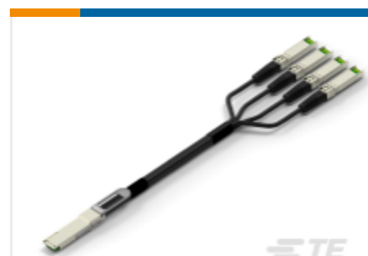
TE 系列/零件编号 2334236-6 QSFP TO [4]SFP25GIG 30AWG 3 METER