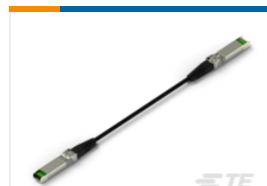
TE 系列/零件编号 2821222-1 SFP28 DIRECT ATTACH CA, 3M, 30AWG