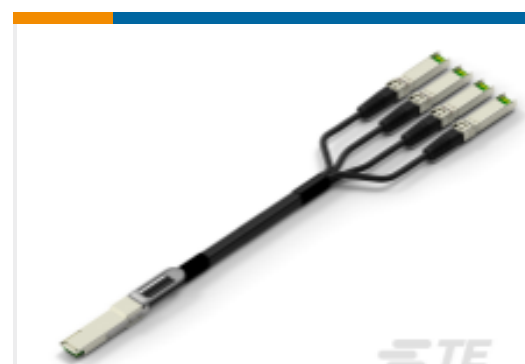
TE 系列/零件编号 2334236-2 QSFP TO [4]SFP+, 28G, 30AWG, 1 METER