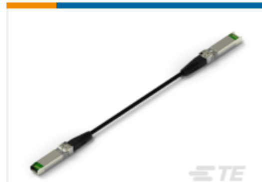
TE 系列/零件编号 2821222-2 SFP28 DIRECT ATTACH CA, 2M, 30AWG