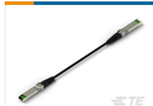
TE 系列/零件编号 2821224-8 SFP28 DIRECT ATTACH CA, 5M, 26AWG