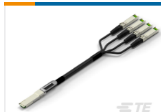
TE 系列/零件编号 4-2334878-4 QSFP TO [4]SFP 56GIG 26AWG 2 METER