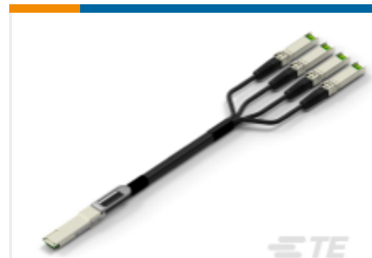
TE 系列/零件编号 4-2334236-4 QSFP TO [4]SFP 56GIG 30AWG 2 METER