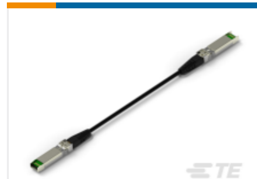
TE 系列/零件编号 2821224-7 SFP28 DIRECT ATTACH CA, 4M, 26AWG