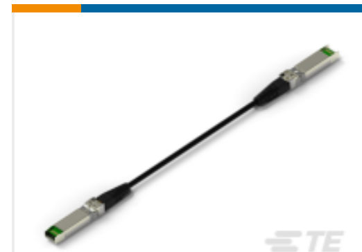
TE 系列/零件编号 4-2821222-5 SFP56 DIRECT ATTACH CA, 2M, 30AWG