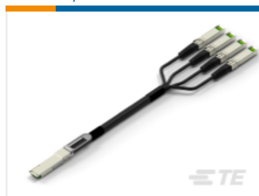
TE 系列/零件编号 2334236-6 QSFP TO [4]SFP25GIG 30AWG 3 METER