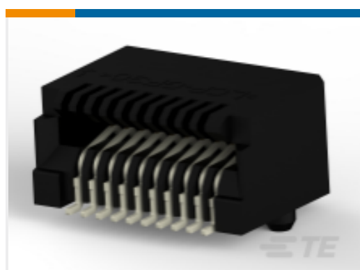
TE 系列/零件编号 1888247-2 20 POS SMT CONN, SFP /SFP+, 15A