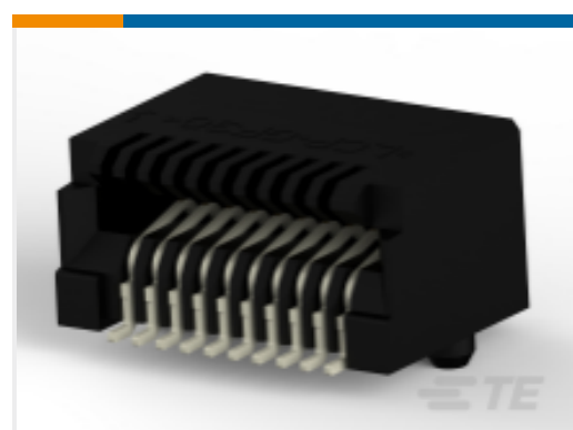
TE 系列/零件编号 1888247-1 20 POS SMT CONN, SFP /SFP+, 30A