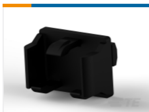
TE 系列/零件编号 1761394-1 DUST COVER, SFP, GANGED & STACKED