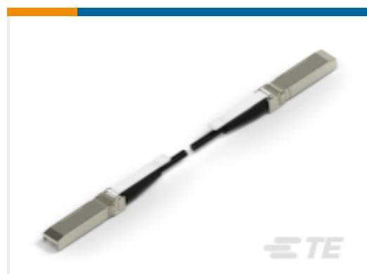
TE 系列/零件编号 2127931-2 C/A, SFP+, GENERIC, 1.0M