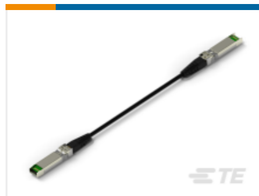
TE 系列/零件编号 2821224-7 SFP28 DIRECT ATTACH CA, 4M, 26AWG