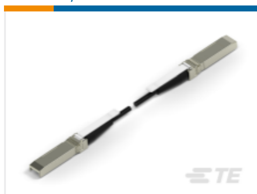
TE 系列/零件编号 2127931-4 C/A, SFP+, GENERIC, 3.0M