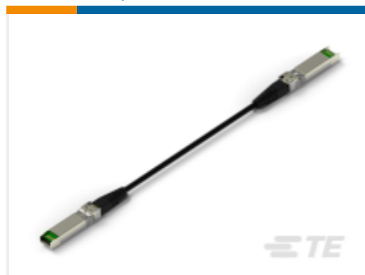
TE 系列/零件编号 2821222-2 SFP28 DIRECT ATTACH CA, 2M, 30AWG