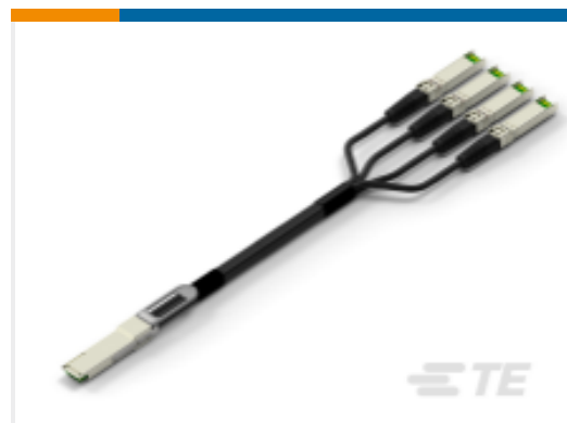
TE 系列/零件编号 2334878-6 QSFP TO [4]SFP 25GIG 26AWG 3 METER