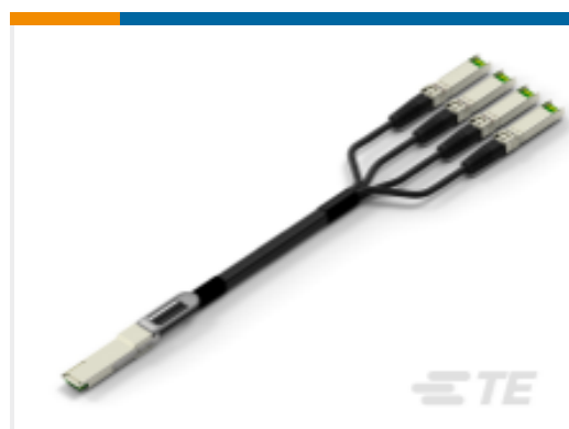
TE 系列/零件编号 2334236-2 QSFP TO [4]SFP+, 28G, 30AWG, 1 METER