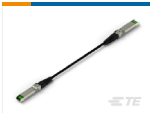
TE 系列/零件编号 2821222-1 SFP28 DIRECT ATTACH CA, 3M, 30AWG