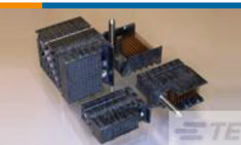
TE 系列/零件编号2007811-2 IMP100S,H,V4P10C,LG, REW39,4.9