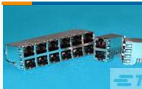
TE 系列/零件编号6116317-4 2X8 OFFSET STK MJ, SHLD,LED(G)