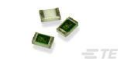
TE 系列/零件编号7-1879335-1 CPF 0603 115R 1% 50PPM 1K RL