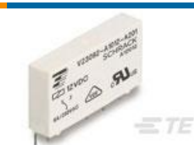
TE 系列/零件编号8-1415067-1 V23092-A1005-A202