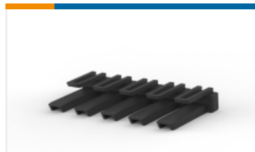
TE 系列/零件编号1744544-5 EP II TPA 05P, BLACK