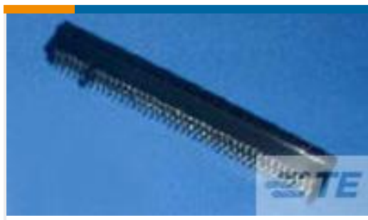
TE 系列/零件编号7-1734774-1 PCI EXP 3.1L 98 POS BLK 30u"