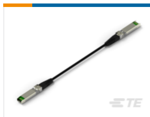
TE 系列/零件编号 2821222-1 SFP28 DIRECT ATTACH CA, 3M, 30AWG