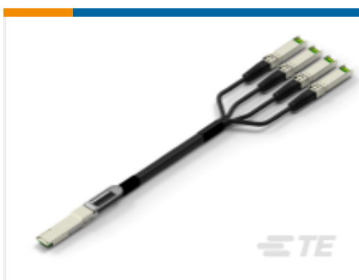
TE 系列/零件编号 2334236-2 QSFP TO [4]SFP+, 28G, 30AWG, 1 METER