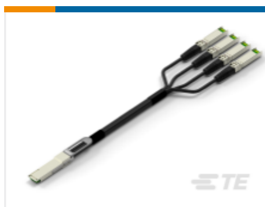
TE 系列/零件编号 2334236-6 QSFP TO [4]SFP25GIG 30AWG 3 METER