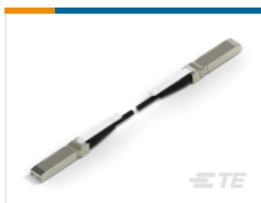
TE 系列/零件编号 2127931-2 C/A, SFP+, GENERIC, 1.0M