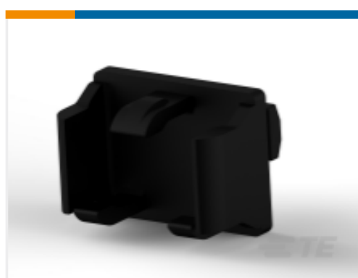
TE 系列/零件编号 1761394-1 DUST COVER, SFP, GANGED & STACKED