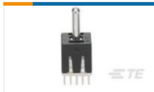
TE 系列/零件编号6643451-1 ICCON,PIN,ASSY