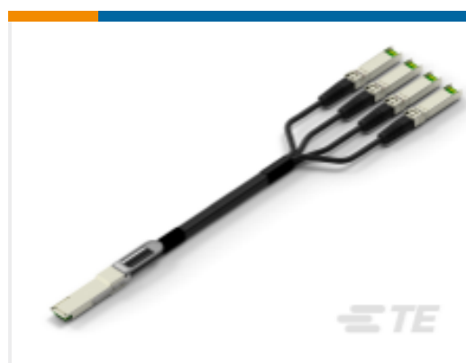
TE 系列/零件编号 2334878-6 QSFP TO [4]SFP 25GIG 26AWG 3 METER