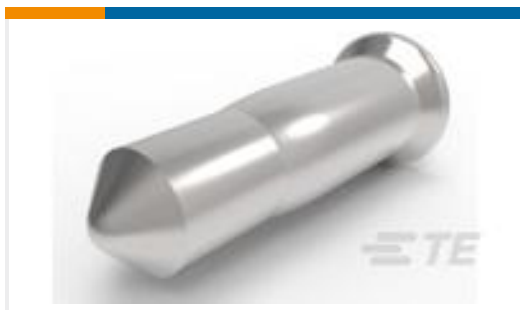
TE 系列/零件编号5645980-2 MSS ASSY SERIES 5 1/2 LP