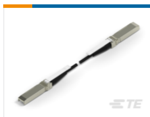
TE 系列/零件编号 2127931-4 C/A, SFP+, GENERIC, 3.0M