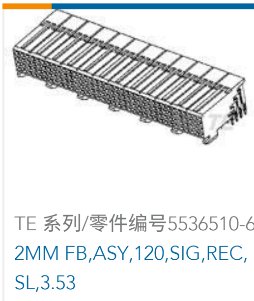
TE 系列/零件编号5536510-6 2MM FB,ASY,120,SIG,REC, SL,3.53