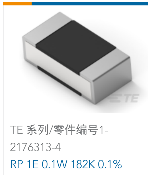
TE 系列/零件编号1- 2176313-4 RP 1E 0.1W 182K 0.1% 25PPM 1K RL