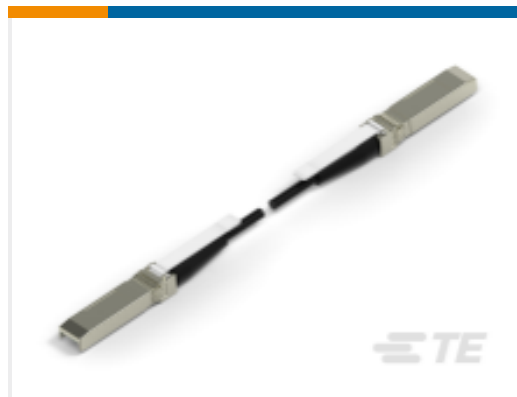
TE 系列/零件编号 2127931-4 C/A, SFP+, GENERIC, 3.0M