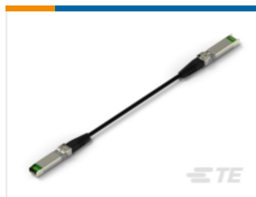
TE 系列/零件编号 2821224-7 SFP28 DIRECT ATTACH CA, 4M, 26AWG