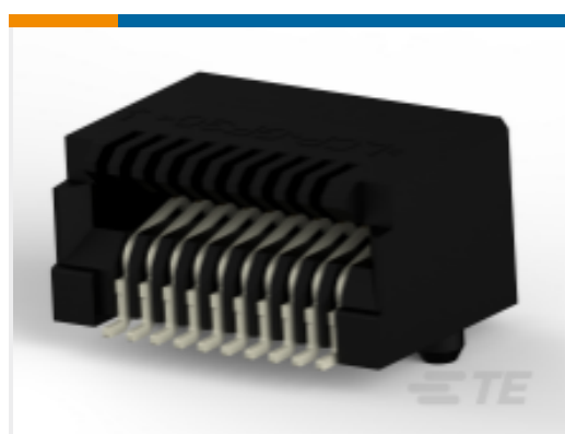
TE 系列/零件编号 1888247-2 20 POS SMT CONN, SFP /SFP+, 15A