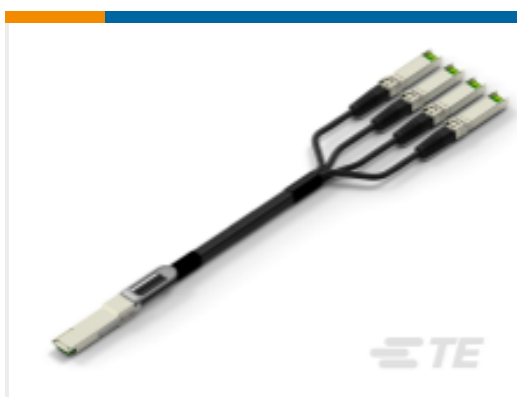
TE 系列/零件编号 2334878-6 QSFP TO [4]SFP 25GIG 26AWG 3 METER