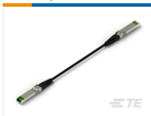
TE 系列/零件编号 2821222-2 SFP28 DIRECT ATTACH CA, 2M, 30AWG