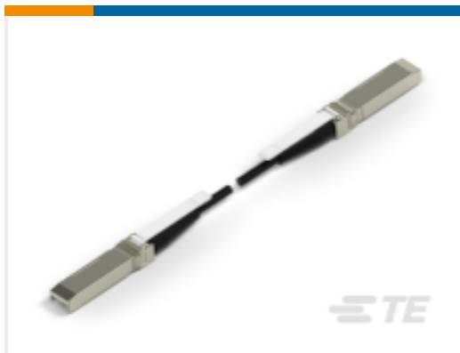
TE 系列/零件编号 2127931-2 C/A, SFP+, GENERIC, 1.0M