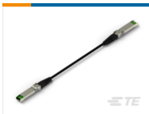
TE 系列/零件编号 2821222-1 SFP28 DIRECT ATTACH CA, 3M, 30AWG