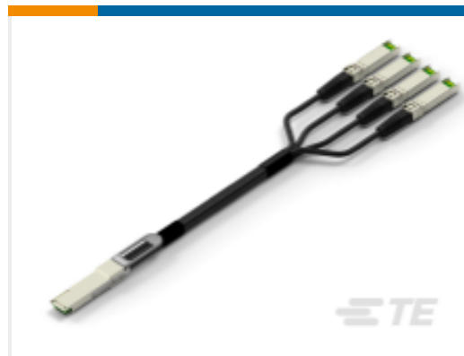
TE 系列/零件编号 2334236-2 QSFP TO [4]SFP+, 28G, 30AWG, 1 METER