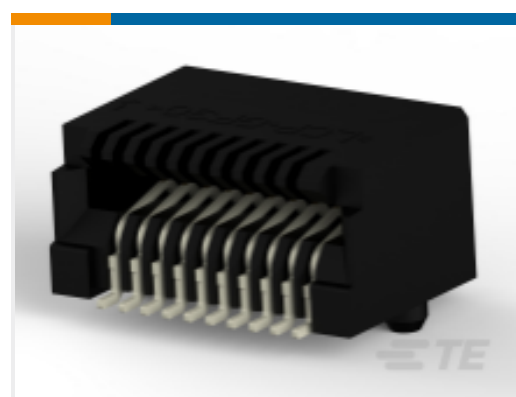
TE 系列/零件编号 1888247-1 20 POS SMT CONN, SFP /SFP+, 30A