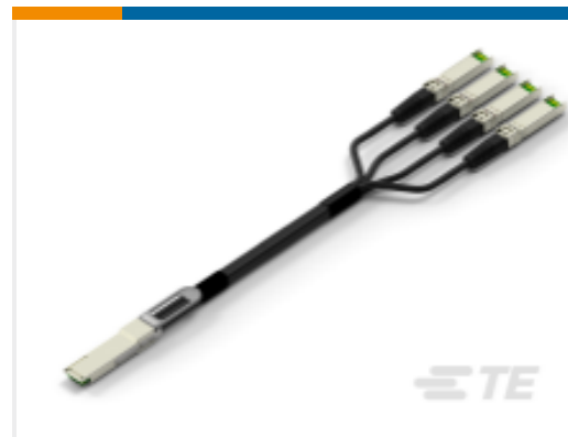
TE 系列/零件编号 2334236-6 QSFP TO [4]SFP25GIG 30AWG 3 METER