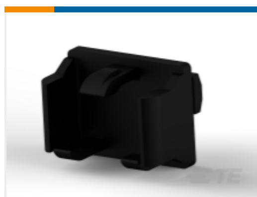
TE 系列/零件编号 1761394-1 DUST COVER, SFP, GANGED & STACKED