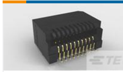
TE 系列/零件编号1888247-1 20 POS SMT CONN, SFP /SFP+, 30A