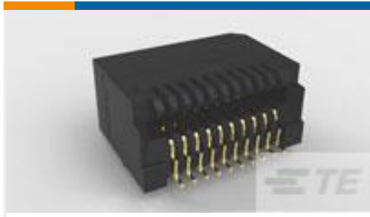
TE 系列/零件编号1367073-1 20 POS SMT CONN, SFP, 15AU