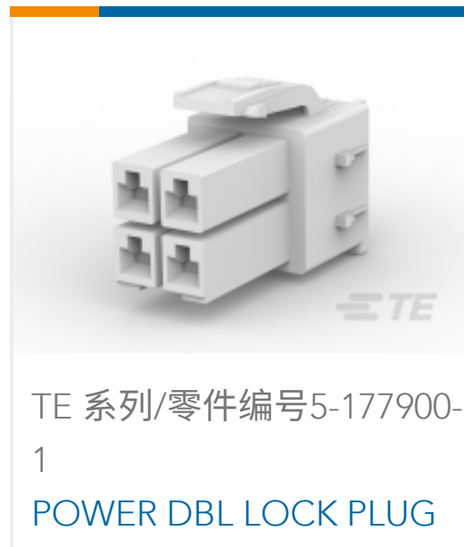
TE 系列/零件编号5-177900-1 POWER DBL LOCK PLUG HSG 4P(GWT)