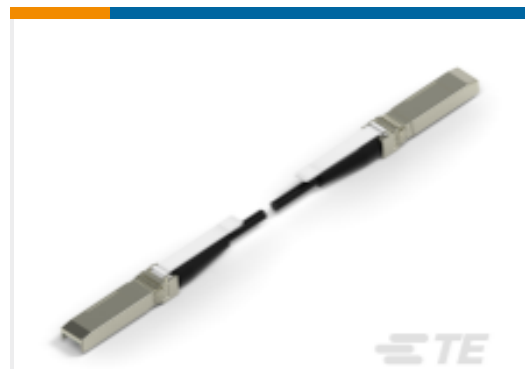
TE 系列/零件编号 2127931-2 C/A, SFP+, GENERIC, 1.0M