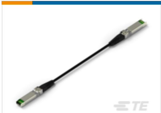
TE 系列/零件编号 2821224-7 SFP28 DIRECT ATTACH CA, 4M, 26AWG