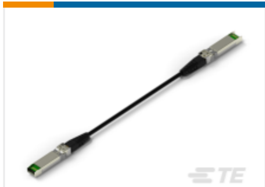
TE 系列/零件编号 2821222-2 SFP28 DIRECT ATTACH CA, 2M, 30AWG