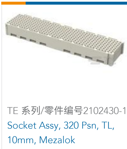
TE 系列/零件编号2102430-1 Socket Assy, 320 Psn, TL, 10mm, Mezalok