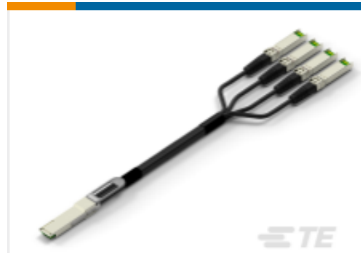
TE 系列/零件编号 2334878-6 QSFP TO [4]SFP 25GIG 26AWG 3 METER