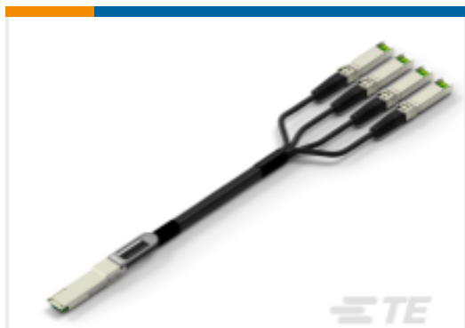
TE 系列/零件编号 2334236-2 QSFP TO [4]SFP+, 28G, 30AWG, 1 METER