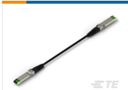
TE 系列/零件编号 2821222-1 SFP28 DIRECT ATTACH CA, 3M, 30AWG