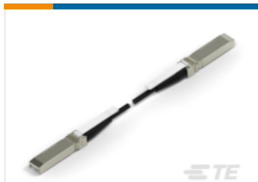
TE 系列/零件编号 2127931-4 C/A, SFP+, GENERIC, 3.0M