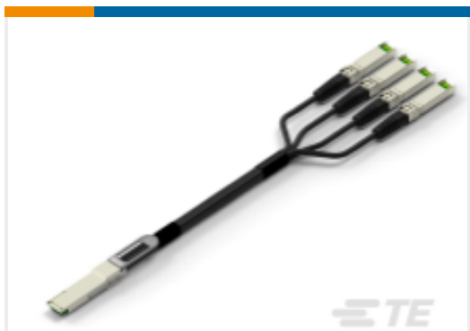
TE 系列/零件编号 2334236-6 QSFP TO [4]SFP25GIG 30AWG 3 METER