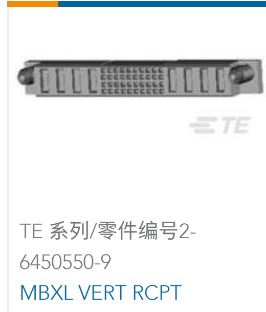
TE 系列/零件编号2- 6450550-9 MBXL VERT RCPT 4P+40S+4P