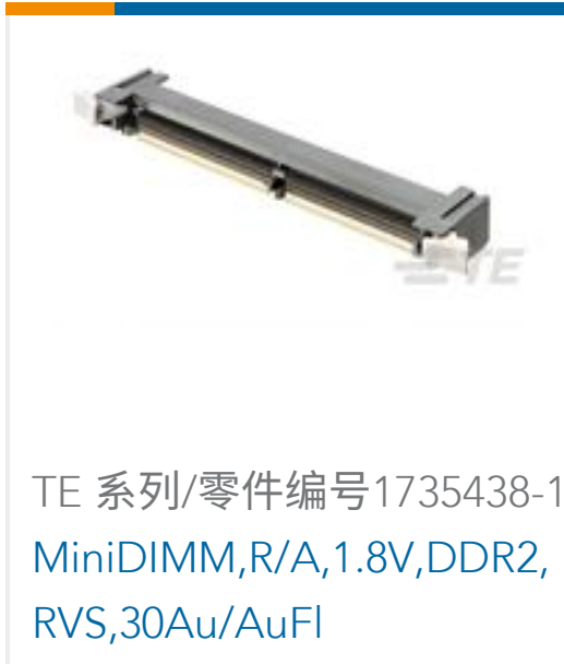
TE 系列/零件编号1735438-1 MiniDIMM,R/A,1.8V,DDR2, RVS,30Au/AuFI