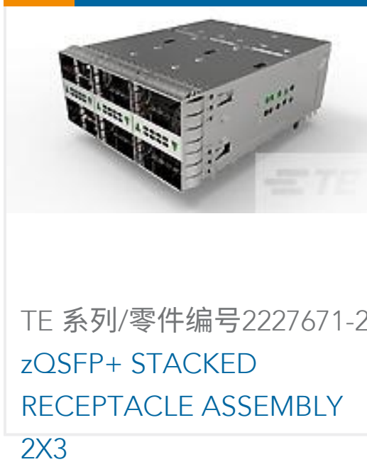
TE 系列/零件编号2227671-2 zQSFP+ STACKED RECEPTACLE ASSEMBLY 2X3