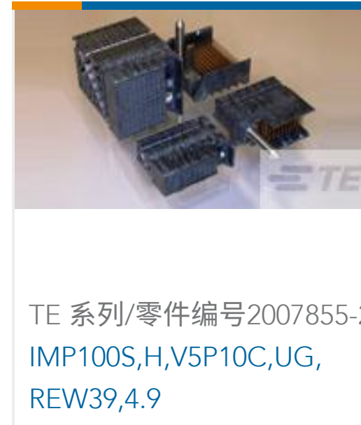
TE 系列/零件编号2007855-2 IMP100S,H,V5P10C,UG, REW39,4.9