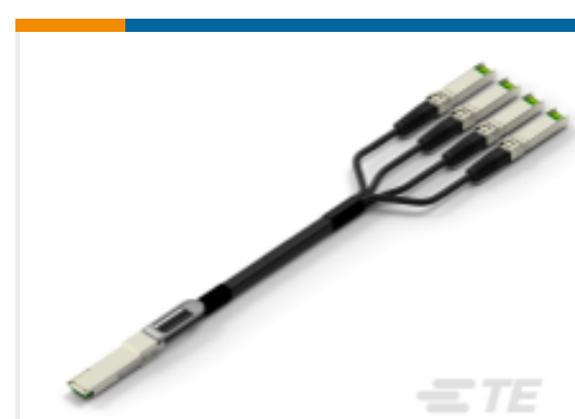
TE 系列/零件编号 2334236-6 QSFP TO [4]SFP25GIG 30AWG 3 METER