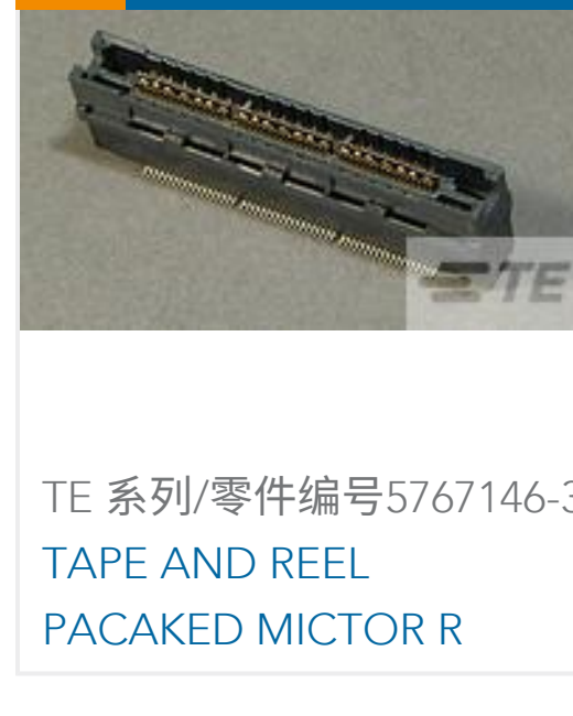
TE 系列/零件编号5767146-3 TAPE AND REEL PACKED MICTOR R