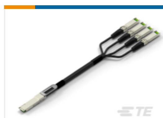
TE 系列/零件编号 2334236-2 QSFP TO [4]SFP+, 28G, 30AWG, 1 METER