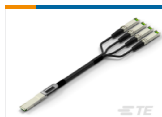
TE 系列/零件编号 2334878-6 QSFP TO [4]SFP 25GIG 26AWG 3 METER