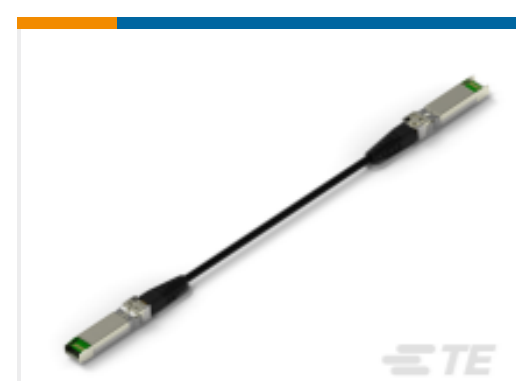
TE 系列/零件编号 2821222-1 SFP28 DIRECT ATTACH CA, 3M, 30AWG