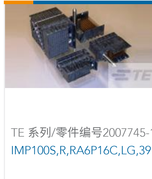
TE 系列/零件编号2007745-1 IMP100S,R,RA6P16C,LG,39