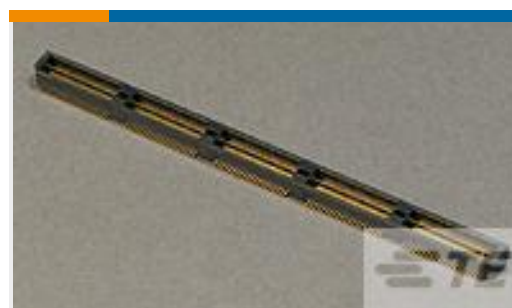
TE 系列/零件编号1658013-5 MSB0.80PL5ASY200FL,-,10, -TY