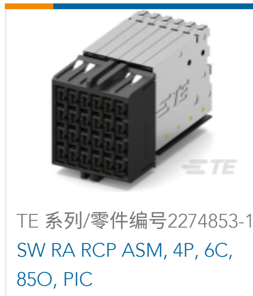
TE 系列/零件编号2274853-1 SW RA RCP ASM, 4P, 6C, 85O, PIC