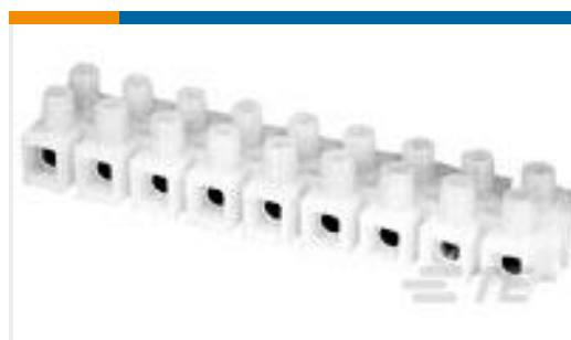
TE 系列/零件编号1-1986469-2 TSB2000K12DSHT=EUROPA BL,14.5M