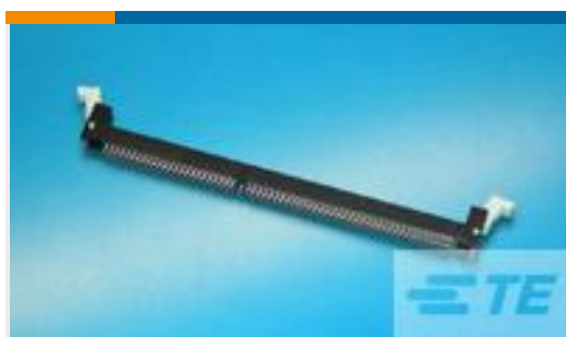
TE 系列/零件编号1-1932031-2 VERTICAL DDR3 DIMM, 240 POSITION, LR