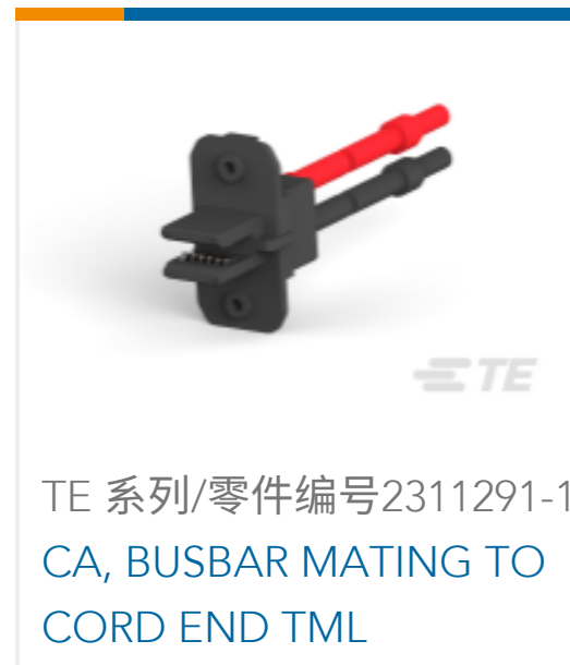
TE 系列/零件编号2311291-1 CA, BUSBAR MATING TO CORD END TML