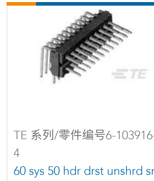
TE 系列/零件编号6-103916- 4 60 sys 50 hdr drst unshrd sn