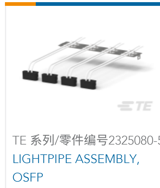
TE 系列/零件编号2325080-5 LIGHTPIPE ASSEMBLY, OSFP