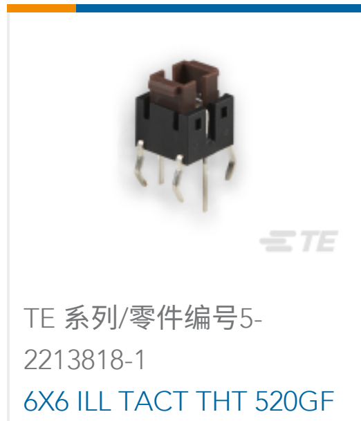
TE 系列/零件编号5- 2213818-1 6X6 ILL TACT THT 520GF LI YELLOW GREEN