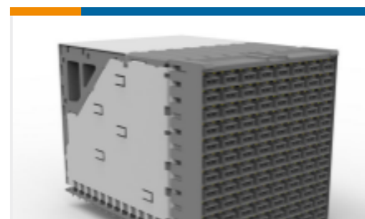
TE 系列/零件编号2187576-1 SW PIR RECT, 100OHM, 12X8