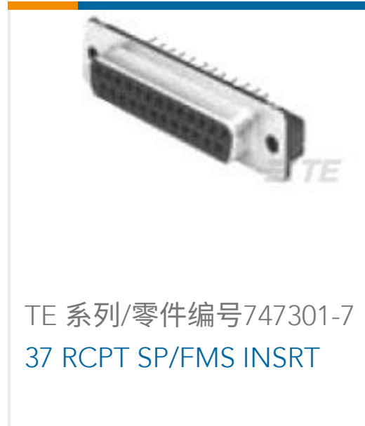
TE 系列/零件编号747301-7 37 RCPT SP/FMS INSRT