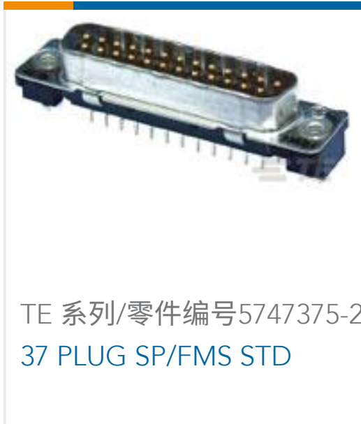
TE 系列/零件编号5747375-2 37 PLUG SP/FMS STD