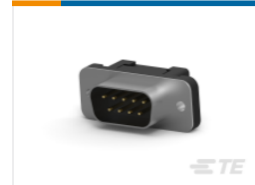
TE 系列/零件编号 1658608-4 09 POS HDF PLUG, MS, LEAD FREE