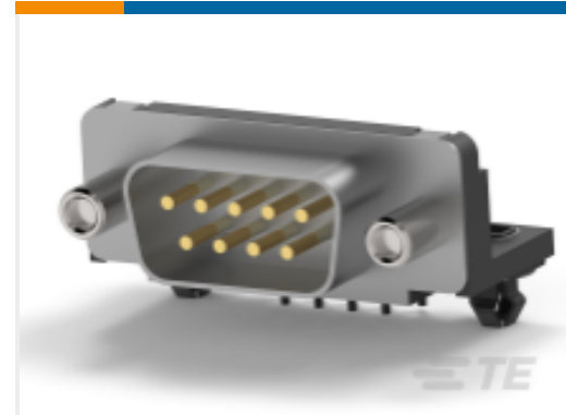
TE 系列/零件编号 5788793-1 09 HTMSFL PLUG RA 318 (SL, BL)