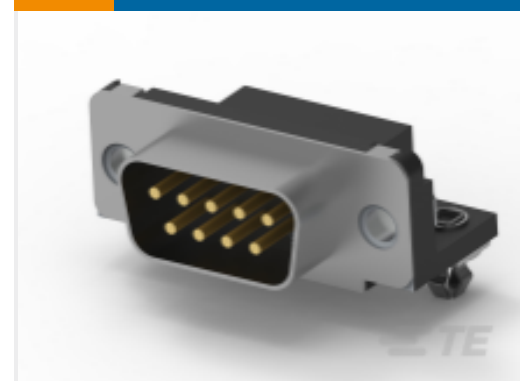
TE 系列/零件编号 5788792-2 09 HTMSFL PLUG RA 318 (IN, BL)