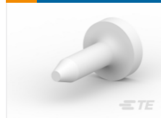
TE 系列/零件编号 206509-1 SIZE 20 KEYING PLUG