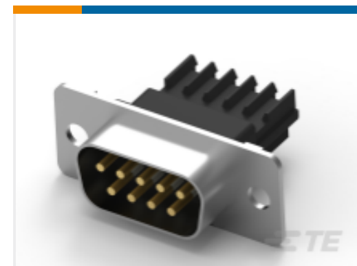
TE 系列/零件编号 1-745492-8 09 HDE MS PLUG, 22-26, LEAD FREE