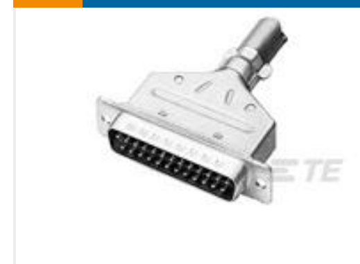
TE 系列/零件编号 747515-7 09 HDE PMOLD PLUG, LEAD FREE