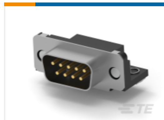
TE 系列/零件编号 5747250-3 09 MSFL PLUG RA 318 (IN, FM)