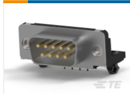
TE 系列/零件编号 5788792-1 09 HTMSFL PLUG RA 318 (IN, BL)