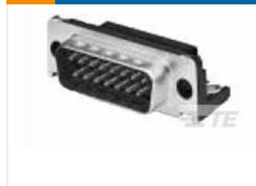
TE 系列/零件编号 5788793-2 09 HTMSFL PLUG RA 318 (SL, BL)