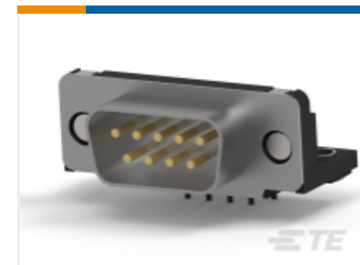
TE 系列/零件编号 5747250-4 09 MSFL PLUG RA 318 (IN, FM)