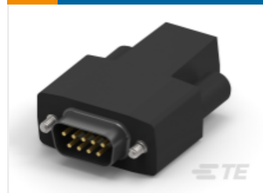
TE 系列/零件编号 1-747944-5 09 SHLDG ENCL PLUG, LEAD FREE