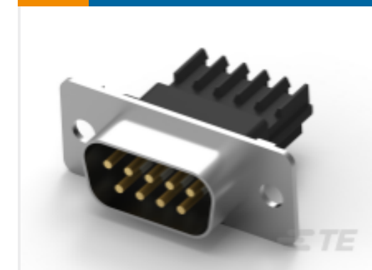
TE 系列/零件编号 1-745492-7 09 HDE MS PLUG, 26-30, LEAD FREE