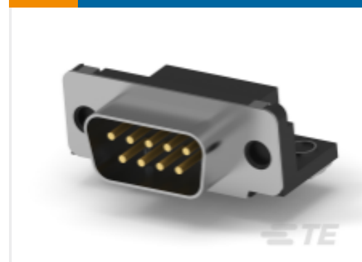
TE 系列/零件编号 5747250-2 09 MSFL PLUG RA 318 (FM)