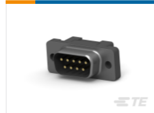
TE 系列/零件编号 1658613-4 09 POS HDF PLUG, MS, LEAD FREE