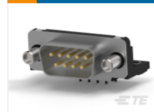
TE 系列/零件编号 5747250-6 09 MSFL PLUG RA 318 (SL, FM)