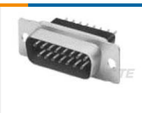
TE 系列/零件编号 5745412-7 25 PLUG SP/MS STD