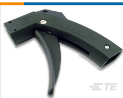
TE 系列/零件编号 58074-1 MANUAL HANDLE W/O HEAD