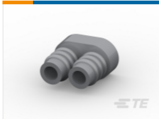
TE 系列/零件编号2213782-2 UNIVERSAL MATE-N-LOK 2-PSN WIRE SEAL