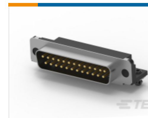
TE 系列/零件编号 747842-4 25 MSFL PLUG RA 318 (IN, FM,BL)