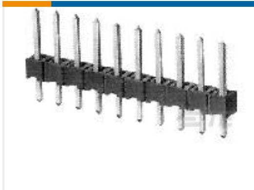
TE 系列/零件编号1-103185-2 12 MODII HDR SRST B/A . 100CL