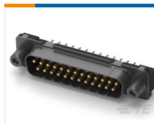
TE 系列/零件编号 3-338311-2 25POS.HD20 PLG ASSY