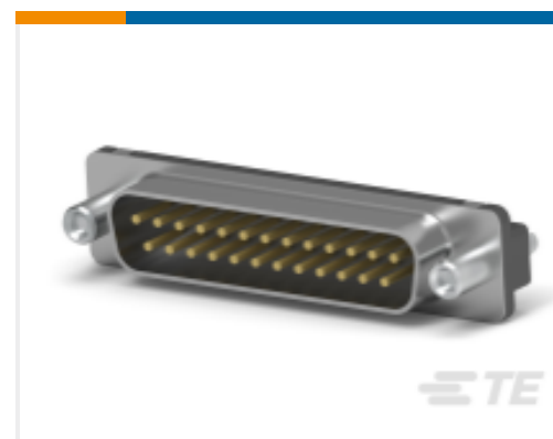
TE 系列/零件编号 5748027-1 25 PLUG SP/FMS (IN,SL)