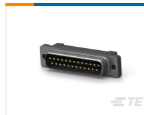
TE 系列/零件编号 1658613-2 25 POS HDF PLUG, MS, LEAD FREE