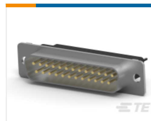
TE 系列/零件编号 5205737-7 25 PLUG SP/MS STD