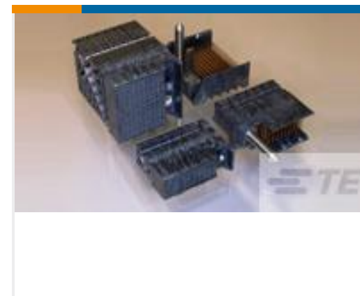
TE 系列/零件编号2132424-1 IMP100O,R,RA3P6C,UG,39