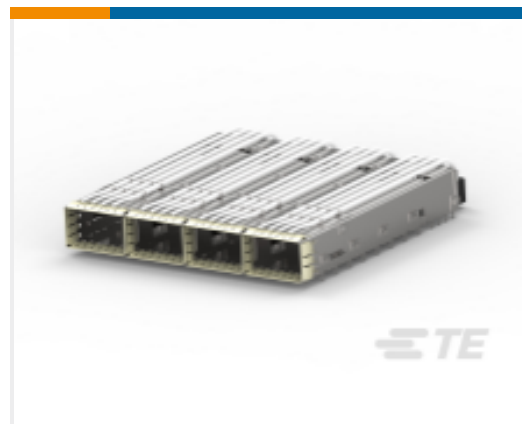
TE 系列/零件编号4- 2338495-1 CAGE ASSEMBLY, 4 LP PER PORT, 1X4, OSFP