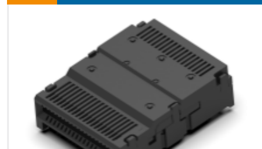
TE 系列/零件编号2318579-1 RCPT CONN R/A SMT 76 POSN QSFP DD