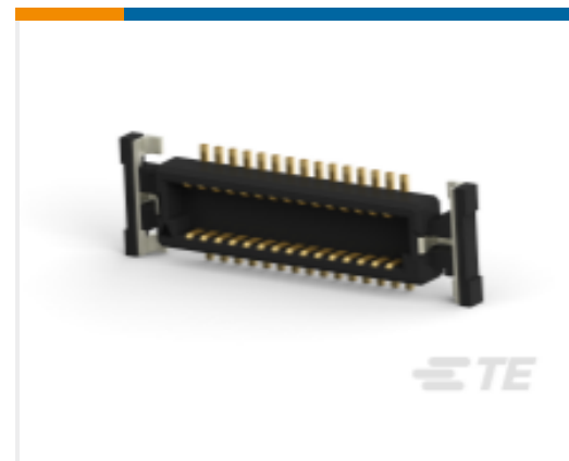
TE 系列/零件编号3- 5353515-0 ON TAPING (EMBOSS) 0.5 MM FS CONN. TAB AS