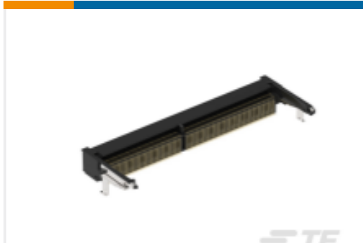
TE 系列/零件编号2309413-5 DDR4 SODIMM 260P 9.2H STD