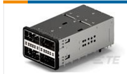
TE 系列/零件编号2214593-1 zQSFP+ STACKED RECEPTACLE ASSEMBLY 2X2