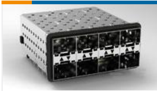
TE 系列/零件编号2007399-6 SFP+assy 2x4 Gasket Inner Lp Sn