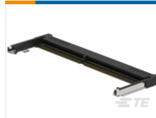
TE 系列/零件编号2309407-5 DDR4 SODIMM 260P 4.0H STD