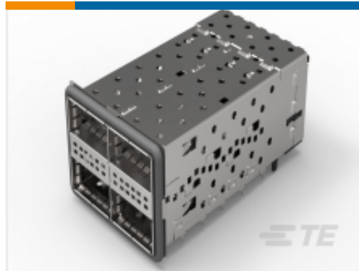
TE 系列/零件编号2214574-9 2X2 QSFP CAGE AND PT CONN ASSY,W/O LP