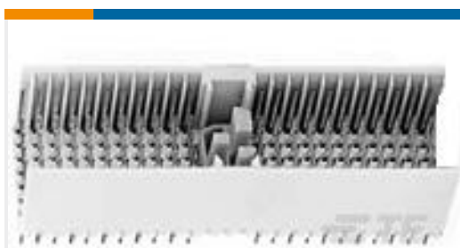
TE 系列/零件编号5106509-1 2MMHM PIN HDR, TYPE A 154POS 7R