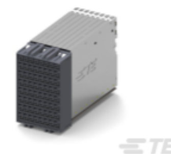
TE 系列/零件编号2274730-1 SW RA RCP ASM, 8P, 8C, 85O, PIC,