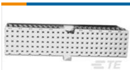
TE 系列/零件编号5646574-1 Z-PACK A/B REC ASY 125P 2MMHM