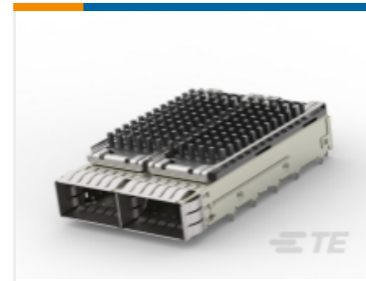
TE 系列/零件编号 2170806-5 CAGE ASSEMBLY, 1X2, QSFP28, SPRING, HS