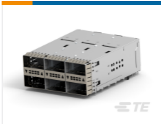
TE 系列/零件编号 2227671-3 zQSFP+ STACKED RECEPTACLE ASSEMBLY 2X3