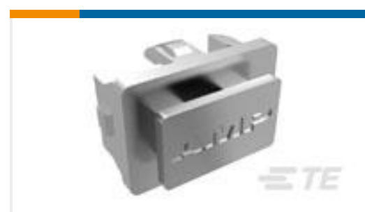
TE 系列/零件编号1367147-1 SFP COVER, UNPLATED