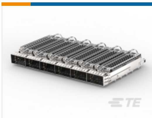
TE 系列/零件编号 2170708-1 CAGE ASSY, 1X6, QSFP28, SPRING, HS, LP