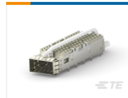
TE 系列/零件编号 2170705-7 CAGE ASSY, QSFP28 1X1, SPRING, HS, LP