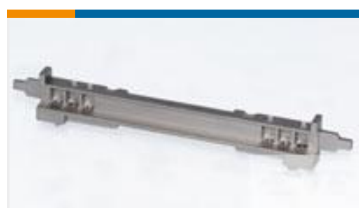
TE 系列/零件编号2057592-2 CFP Guide Rail