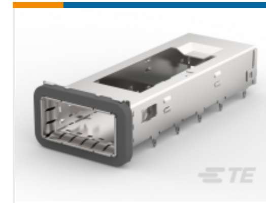
TE 系列/零件编号 2170752-2 CAGE ASSEMBLY, QSFP28 1X1, GASKET