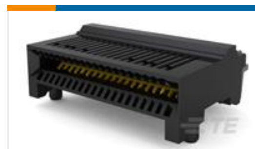
TE 系列/零件编号1551920-2 zQSFP+ connector assembly