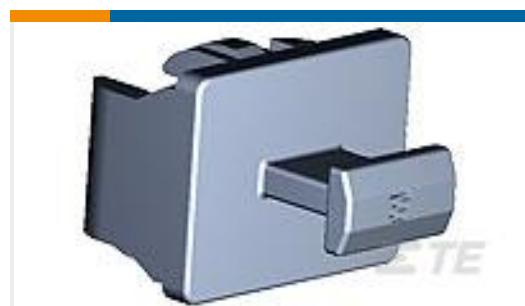
TE 系列/零件编号1761394-1 DUST COVER, SFP, GANGED & STACKED