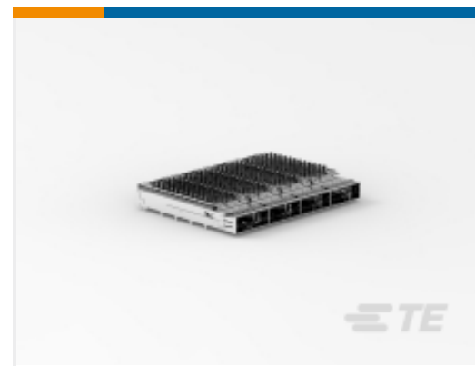
TE 系列/零件编号 2170745-2 CAGE ASSY, 1X4, QSFP28, SPRING, HS