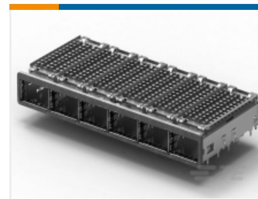
TE 系列/零件编号 2143330-1 1X6 QSFP Kit Assy Bhnd Bzl,PCI