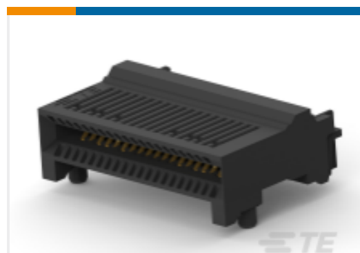
TE 系列/零件编号 1551920-2 zQSFP+ connector assembly