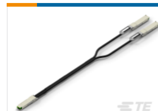
TE 系列/零件编号 2333801-2 QSFP TO (2)QSFP, 25G, 1 METER, 30AWG