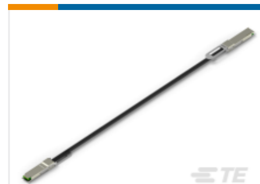
TE 系列/零件编号 2333842-6 QSFP 25GIG 26AWG 3 METER