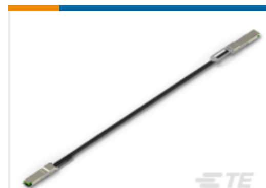
TE 系列/零件编号 2333393-5 QSFP 25GIG 30AWG 2 METER