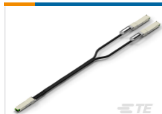
TE 系列/零件编号 2333801-6 QSFP TO (2)QSFP, 25G, 3 METER, 30AWG