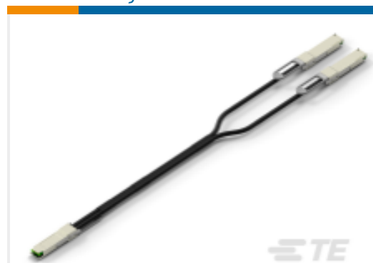
TE 系列/零件编号 2333801-4 QSFP TO (2)QSFP, 25G, 2 METER, 30AWG