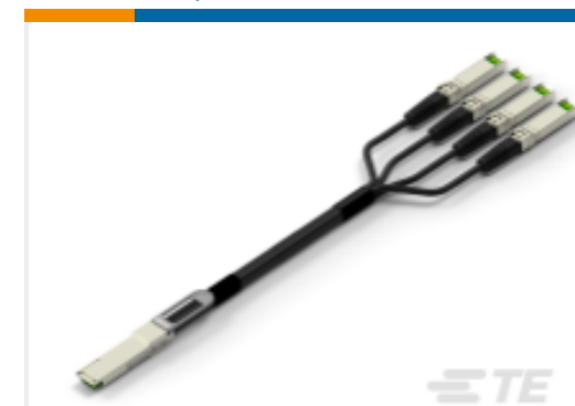
TE 系列/零件编号 2334236-2 QSFP TO [4]SFP+, 28G, 30AWG, 1 METER