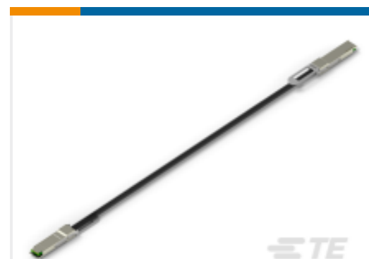
TE 系列/零件编号 2333393-3 QSFP 25GIG 30AWG 1 METER