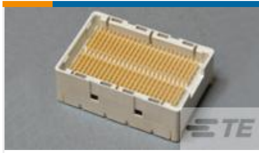
TE 系列/零件编号6- 1761612-3 STEP-Z PLUG 13MM 104P LF ST