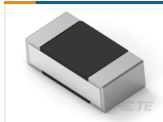
TE 系列/零件编号7- 2176311-4 RP 1E 0.1W 6K65 0.1% 25PPM 1K RL