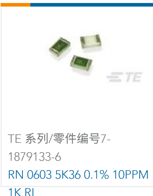
TE 系列/零件编号7- 1879133-6 RN 0603 5K36 0.1% 10PPM 1K RL