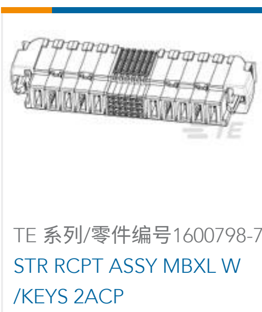
TE 系列/零件编号1600798-7 STR RCPT ASSY MBXL W /KEYS 2ACP