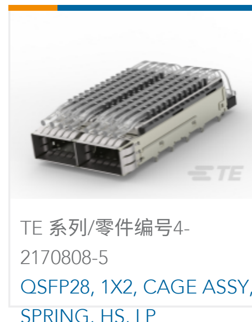
TE 系列/零件编号4- 2170808-5 QSFP28, 1X2, CAGE ASSY, SPRING, HS, LP