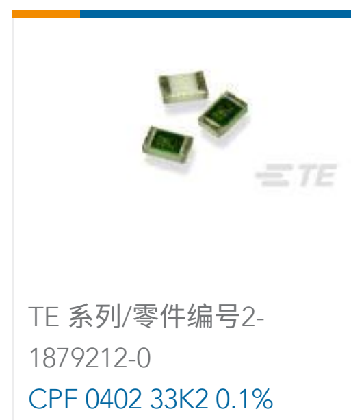
TE 系列/零件编号2- 1879212-0 CPF 0402 33K2 0.1% 25PPM 5K RL