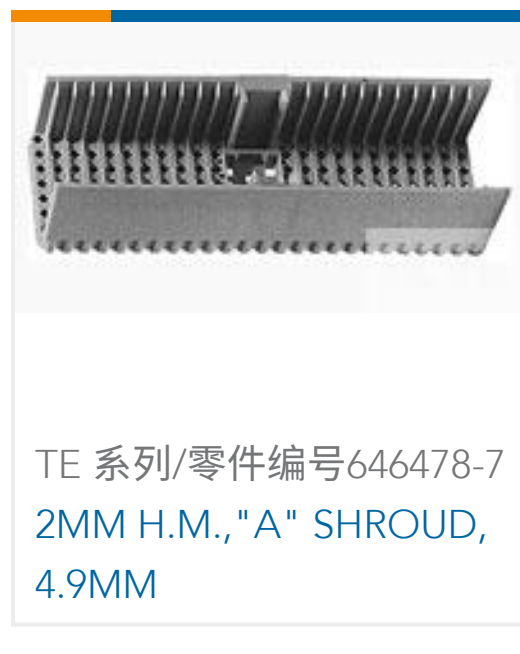
TE 系列/零件编号646478-7 2MM H.M., "A" SHROUD, 4.9MM