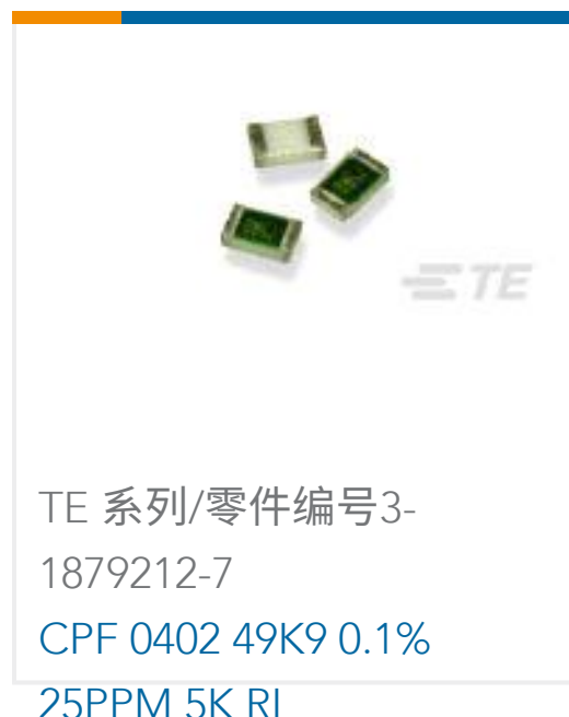
TE 系列/零件编号3- 1879212-7 CPF 0402 49K9 0.1% 25PPM 5K RL