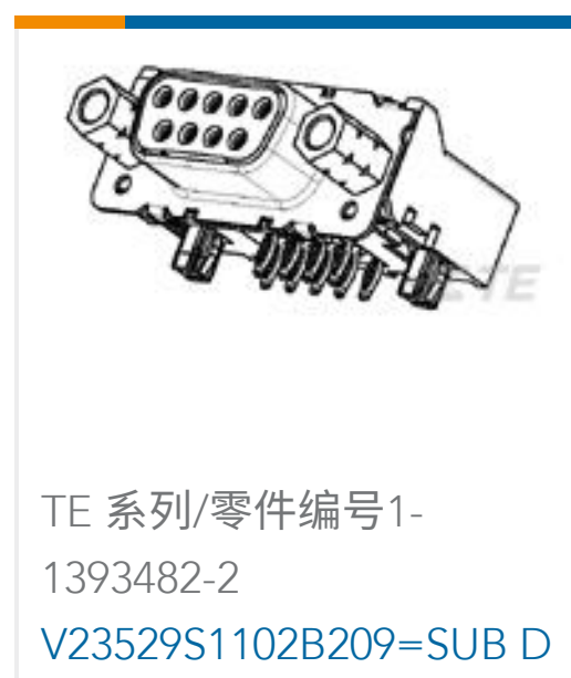
TE 系列/零件编号1- 1393482-2 V23529S1102B209=SUB D EP 90