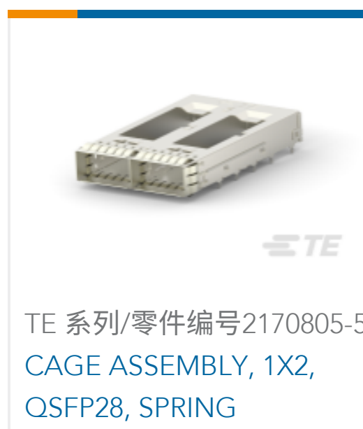
TE 系列/零件编号2170805-5 CAGE ASSEMBLY, 1X2, QSFP28, SPRING