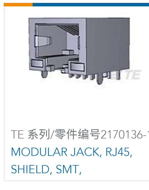
TE 系列/零件编号2170136-1 MODULAR JACK, RJ45, SHIELD, SMT,