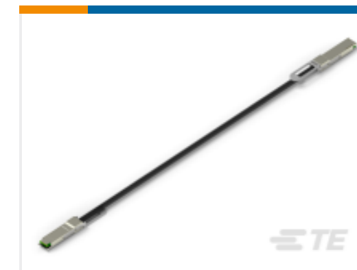
TE 系列/零件编号 2333842-6 QSFP 25GIG 26AWG 3 METER