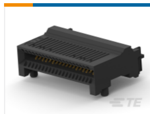
TE 系列/零件编号 1551920-2 zQSFP+ connector assembly