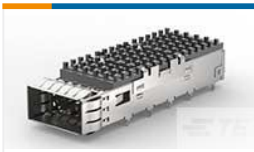
TE 系列/零件编号2170704-4 CAGE ASSY, QSFP28 1X1, SPRING, HS