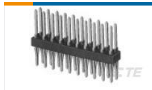
TE 系列/零件编号5-103233-6 14 MODII HDR DRST UNSHRD A/PIN