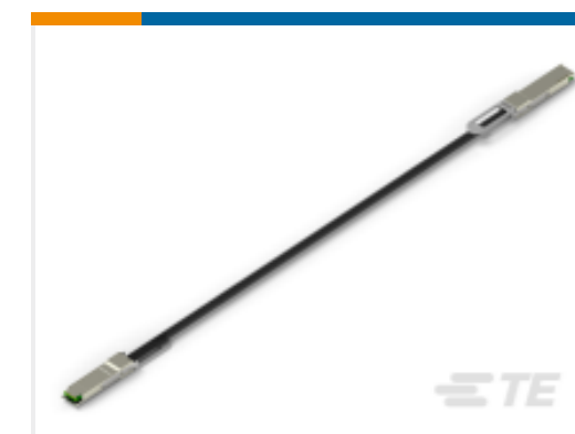
TE 系列/零件编号 2333393-5 QSFP 25GIG 30AWG 2 METER