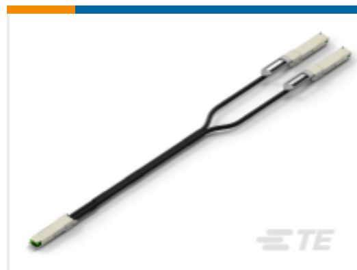
TE 系列/零件编号 2333801-2 QSFP TO (2)QSFP, 25G, 1 METER, 30AWG