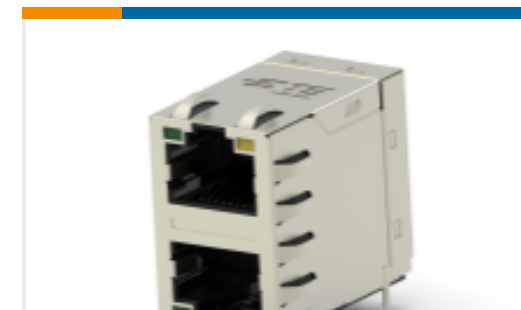
TE 系列/零件编号5-2337995-1 RJ45 JACK MAG. POE 10 /100 LED 2X1