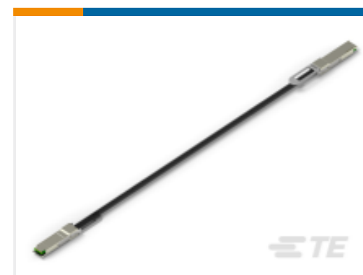
TE 系列/零件编号 2333393-3 QSFP 25GIG 30AWG 1 METER