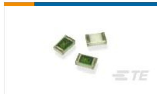
TE 系列/零件编号5-1879129-4 RN 0402 1K82 0.1% 10PPM 5K RL