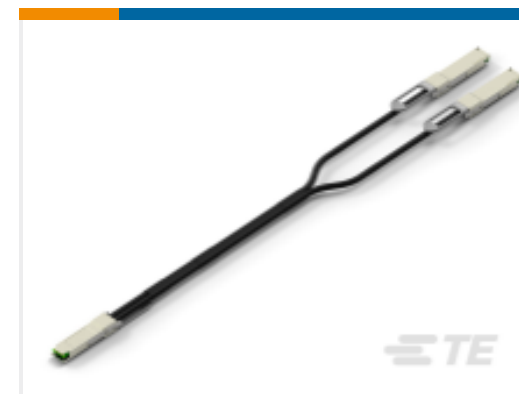
TE 系列/零件编号 2333801-6 QSFP TO (2)QSFP, 25G, 3 METER, 30AWG