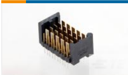
TE 系列/零件编号5120874-1 HS3 10 ROW RECEPTACLE ASSY W/M