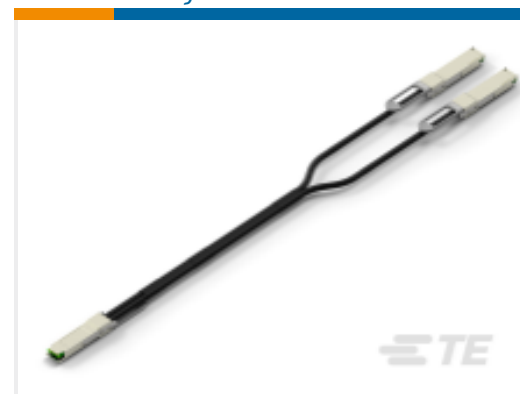
TE 系列/零件编号 2333801-4 QSFP TO (2)QSFP, 25G, 2 METER, 30AWG