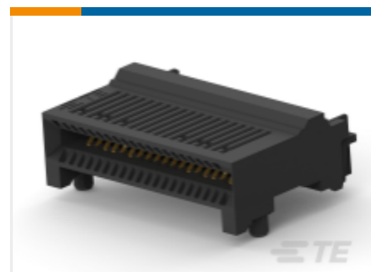
TE 系列/零件编号 1551920-2 zQSFP+ connector assembly