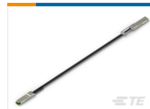
TE 系列/零件编号 2333393-5 QSFP 25GIG 30AWG 2 METER