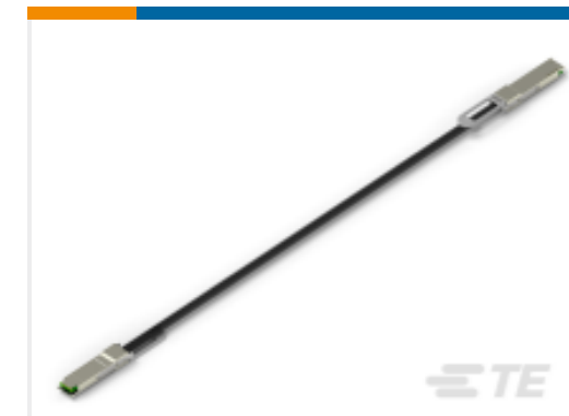
TE 系列/零件编号 2333842-6 QSFP 25GIG 26AWG 3 METER