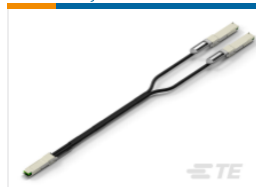
TE 系列/零件编号 2333801-4 QSFP TO (2)QSFP, 25G, 2 METER, 30AWG