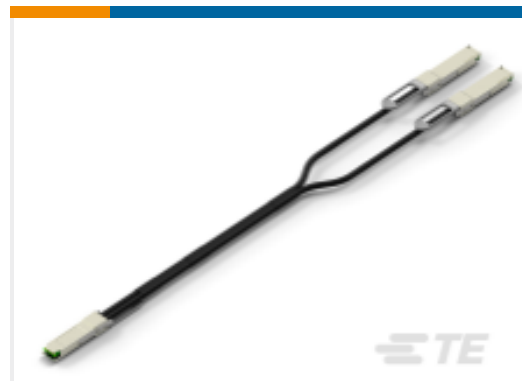
TE 系列/零件编号 2333801-2 QSFP TO (2)QSFP, 25G, 1 METER, 30AWG