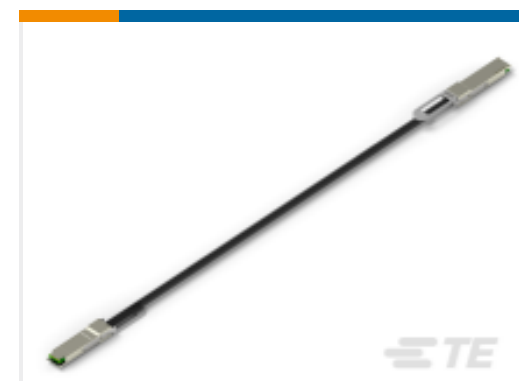
TE 系列/零件编号 2333393-3 QSFP 25GIG 30AWG 1 METER