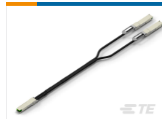
TE 系列/零件编号 2333801-6 QSFP TO (2)QSFP, 25G, 3 METER, 30AWG