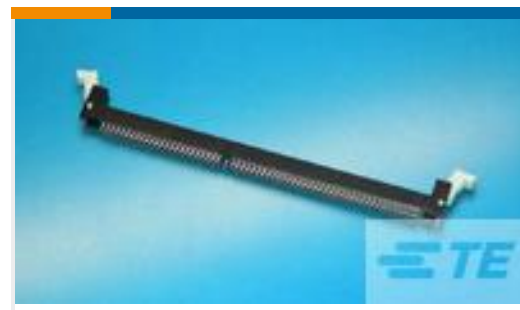
TE 系列/零件编号4- 1932031-7 VERTICAL DDR3 DIMM, 240 POSITION, LR