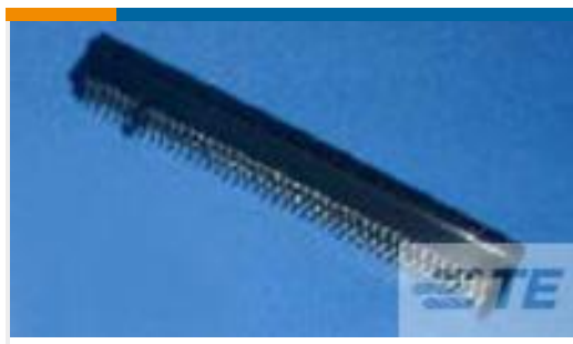
TE 系列/零件编号1- 1734774-4 PCI EXP 3.1L 164 POS WHT 15u"