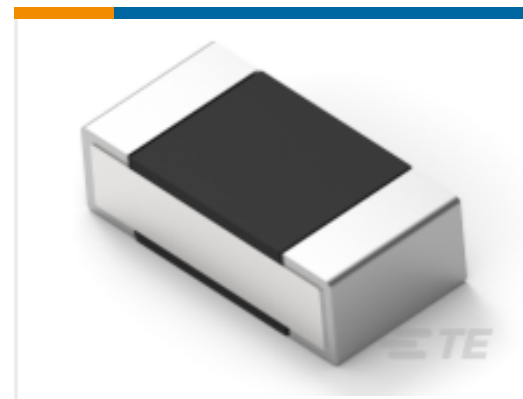
TE 系列/零件编号7- 2176307-7 RP 1E 0.1W 76K8 0.1% 25PPM 5K RL