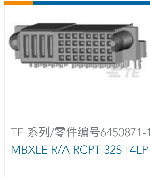
TE 系列/零件编号6450871-1 MBXLE R/A RCPT 32S+4LP