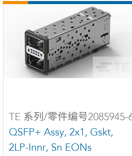
TE 系列/零件编号2085945-6 QSFP+ Assy, 2x1, Gskt, 2LP-Innr, Sn EONs