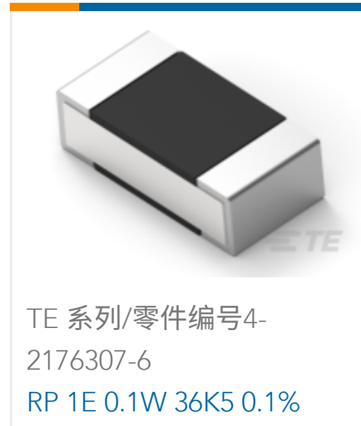
TE 系列/零件编号4-2176307-6 RP 1E 0.1W 36K5 0.1% 25PPM 5K RL