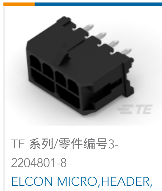
TE 系列/零件编号3-2204801-8 ELCON MICRO,HEADER, VERTICAL DIP,8P