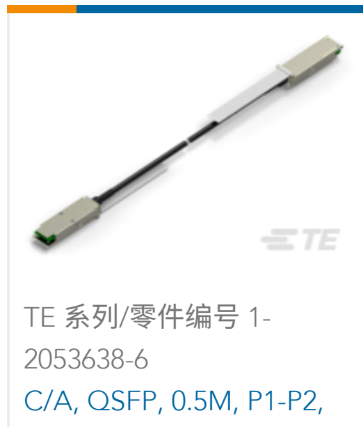
TE 系列/零件编号 1-2053638-6 C/A, QSFP, 0.5M, P1-P2, UNEQUALIZED