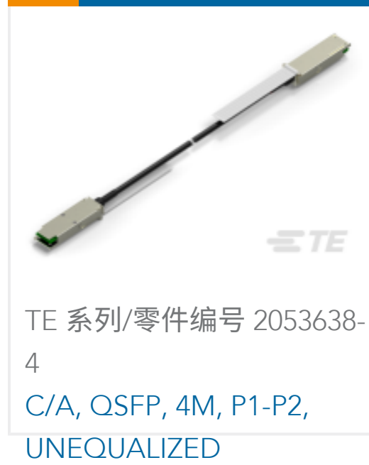
TE 系列/零件编号 2053638-4 C/A, QSFP, 4M, P1-P2, UNEQUALIZED