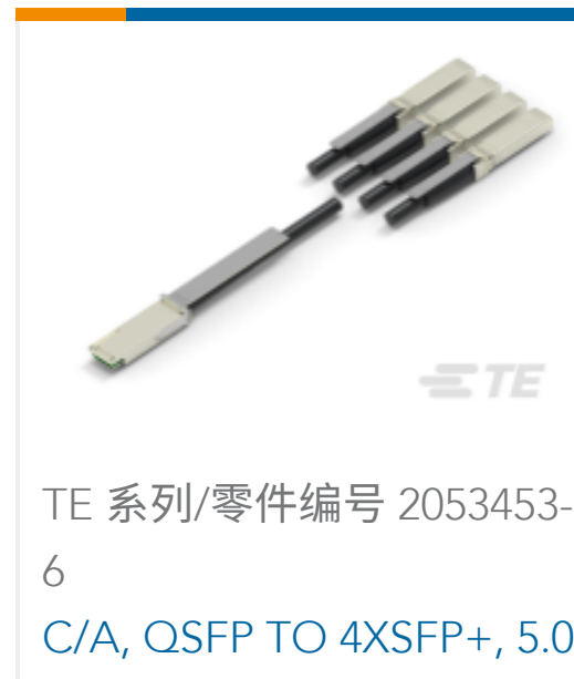
TE 系列/零件编号 2053453-6 C/A, QSFP TO 4XSFP+, 5.0 M