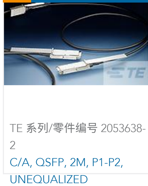
TE 系列/零件编号 2053638-2 C/A, QSFP, 2M, P1-P2, UNEQUALIZED