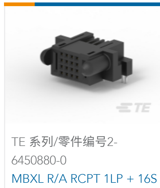
TE 系列/零件编号2-6450880-0 MBXL R/A RCPT 1LP + 16S + 1LP