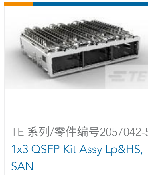
TE 系列/零件编号2057042-5 1x3 QSFP Kit Assy Lp&HS, SAN