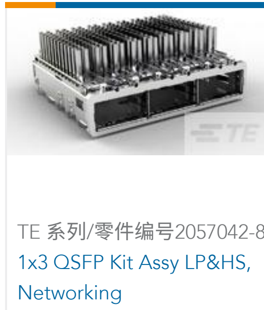
TE 系列/零件编号2057042-8 1x3 QSFP Kit Assy LP&HS, Networking