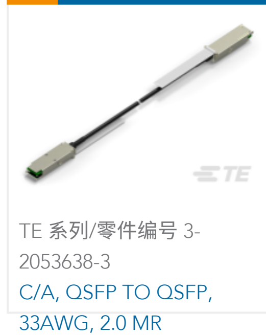
TE 系列/零件编号 3-2053638-3 C/A, QSFP TO QSFP, 33AWG, 2.0 MR