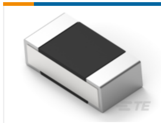
TE 系列/零件编号5- 2176307-7 RP 1E 0.1W 47K5 0.1% 25PPM 5K RL