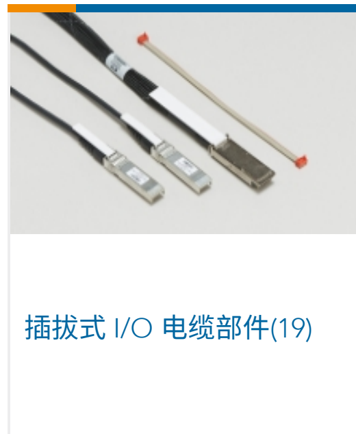
插拔式 I/O 电缆部件(19)