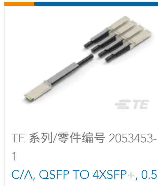
TE 系列/零件编号 2053453-1 C/A, QSFP TO 4XSFP+, 0.5 M