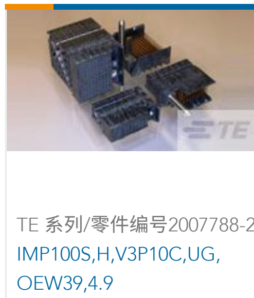
TE 系列/零件编号2007788-2 IMP100S,H,V3P10C,UG, OEW39,4.9