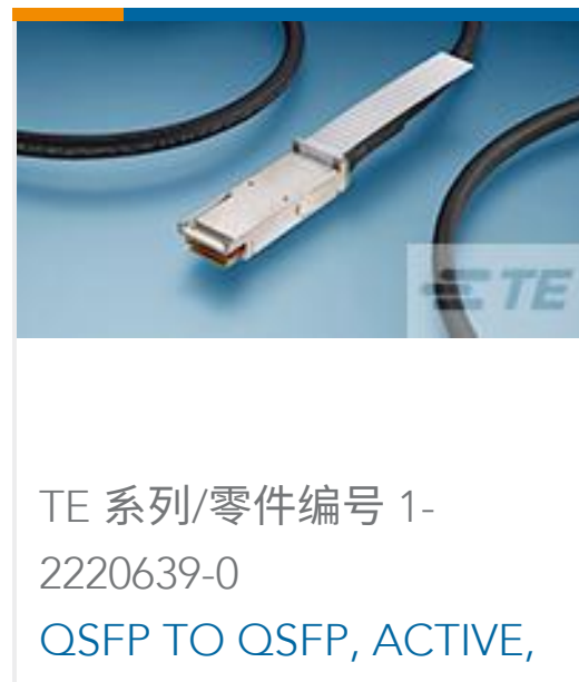
TE 系列/零件编号 1-2220639-0 QSFP TO QSFP, ACTIVE, 28AWG, 10M