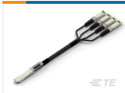
TE 系列/零件编号 2334236-2 QSFP TO [4]SFP+, 28G, 30AWG, 1 METER