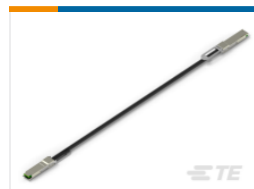
TE 系列/零件编号 2333393-3 QSFP 25GIG 30AWG 1 METER