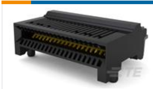
TE 系列/零件编号1551920-2 zQSFP+ connector assembly