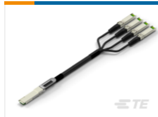
TE 系列/零件编号 2334236-6 QSFP TO [4]SFP25GIG 30AWG 3 METER