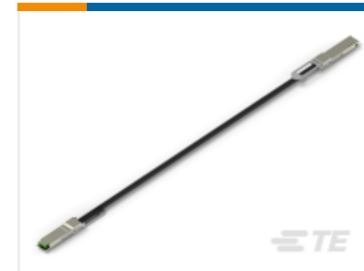
TE 系列/零件编号 4-2333393-3 QSFP 56GIG 30AWG 1 METER