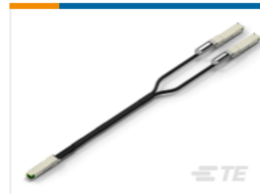
TE 系列/零件编号 2333801-6 QSFP TO (2)QSFP, 25G, 3 METER, 30AWG