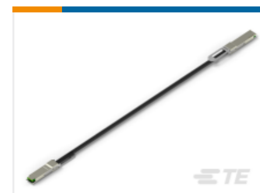
TE 系列/零件编号 2333393-5 QSFP 25GIG 30AWG 2 METER