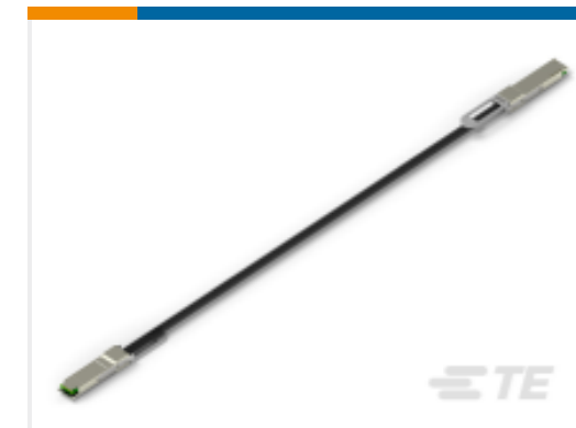
TE 系列/零件编号 2333842-6 QSFP 25GIG 26AWG 3 METER