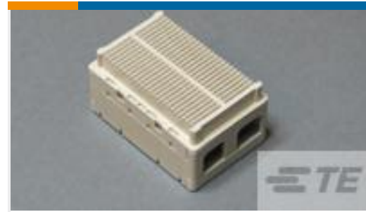
TE 系列/零件编号6- 1761613-5 STEP-Z RCPT 15MM 104P LF ST