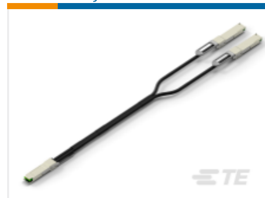
TE 系列/零件编号 2333801-4 QSFP TO (2)QSFP, 25G, 2 METER, 30AWG