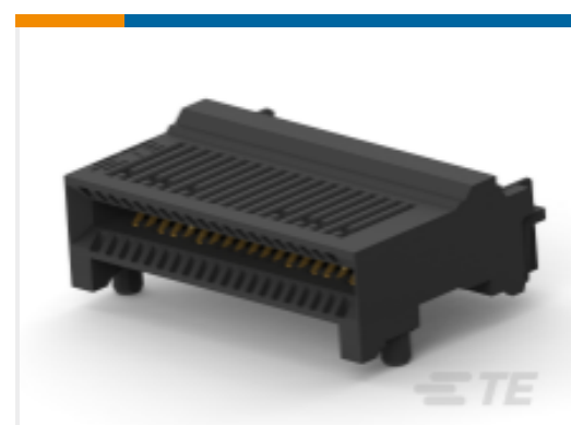
TE 系列/零件编号 1551920-2 zQSFP+ connector assembly