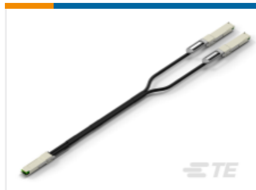
TE 系列/零件编号 2333801-2 QSFP TO (2)QSFP, 25G, 1 METER, 30AWG