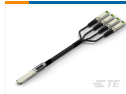
TE 系列/零件编号 2334878-6 QSFP TO [4]SFP 25GIG 26AWG 3 METER