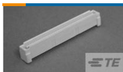
TE 系列/零件编号6123002-2 0.8FH,P08H.5,060,30/Sn,TU