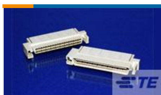
TE 系列/零件编号6367580-4 ASSY Z-DOK+4 HOST BOARD 32PR