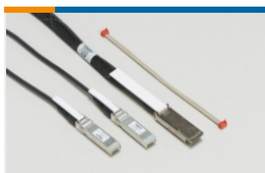
插拔式 I/O 电缆部件(81)