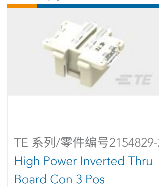
TE 系列/零件编号2154829-2 High Power Inverted Thru Board Con 3 Pos