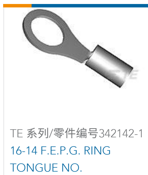
TE 系列/零件编号342142-1 16-14 F.E.P.G. RING TONGUE NO.