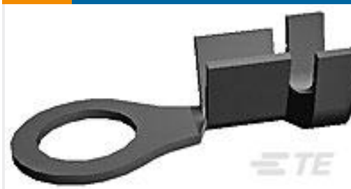
TE 系列/零件编号160701-2 RING TONGUE 18-14 AWG .030 X .394 NPSTL