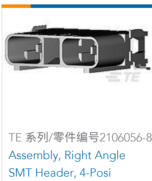
TE 系列/零件编号2106056-8 Assembly, Right Angle SMT Header, 4-Posi