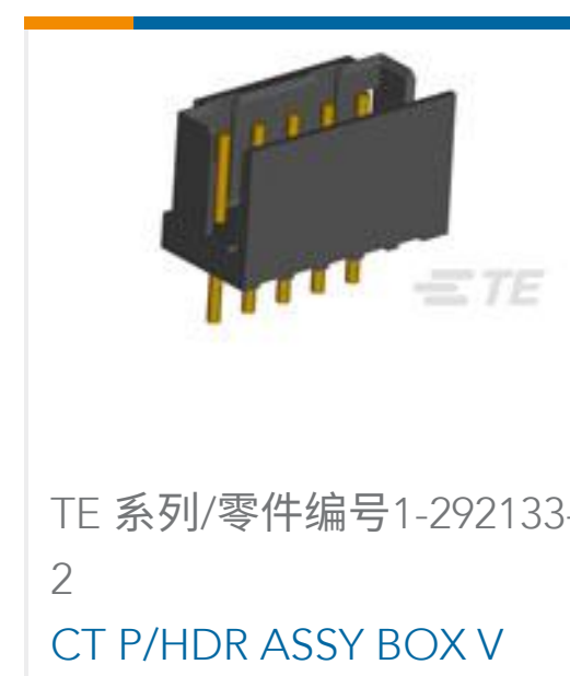
TE 系列/零件编号1-292133-2 CT P/HDR ASSY BOX V 12P W/O KI