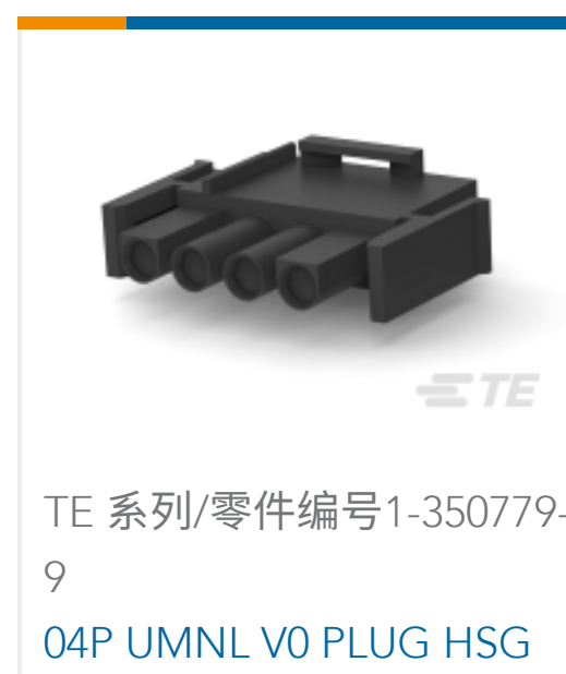
TE 系列/零件编号1-350779-9 04P UMNL V0 PLUG HSG BLACK