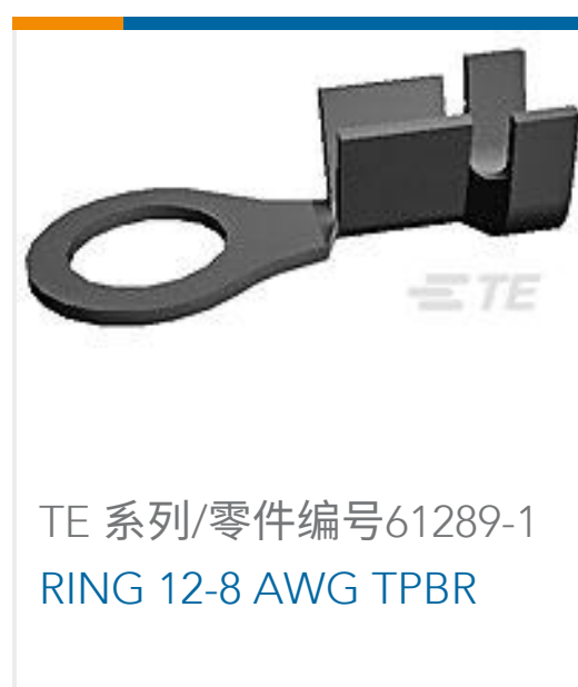
TE 系列/零件编号61289-1 RING 12-8 AWG TPBR