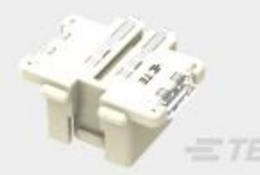
TE 系列/零件编号2154829-2 High Power Inverted Thru Board Con 3 Pos