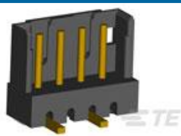
TE 系列/零件编号292172-8 CT POST HDR ASSY 8P IN- TUBE BL